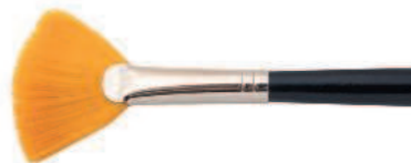
Веерная кисть из искусственного волоса.