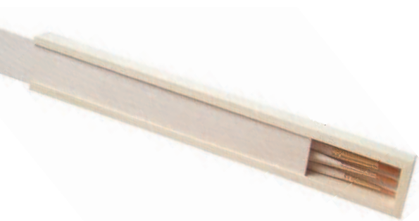
Деревянный пенал с искусственными кисточками.

Всегда стоит проверить, нет ли на кисти остатков краски. В этом случае следы краски останутся на салфетке.