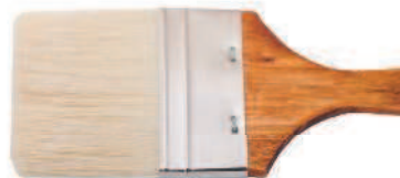
Флейц из свиной щетины.