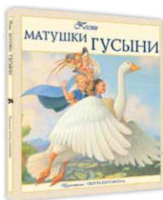
Песни Матушки Гусыни