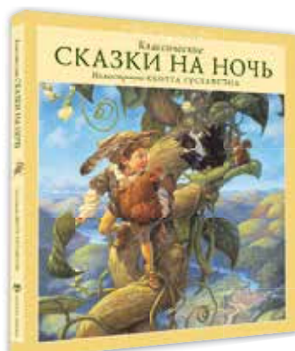
Классические сказки на ночь