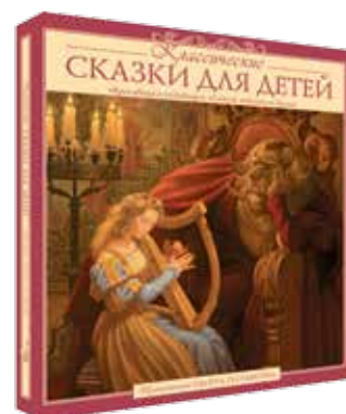
Классические сказки детям