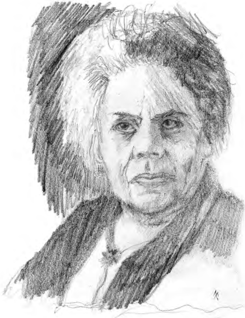
Елена Фабиановна Гнесина