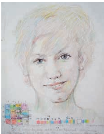
Леонид Луговых. Хромосомный портрет. 2013 Собственность автора