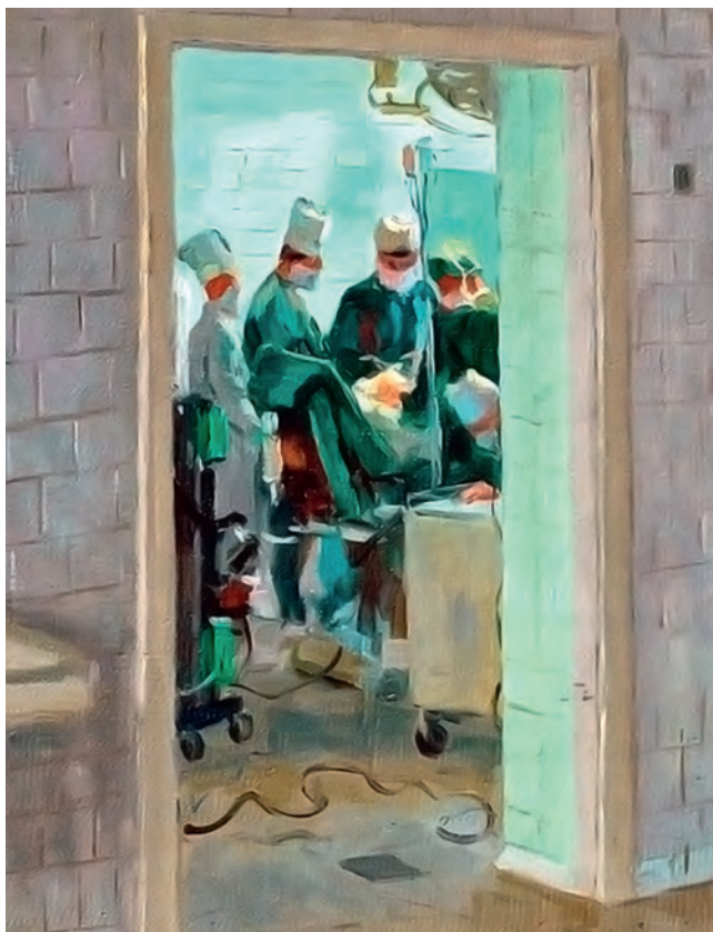
Рис. 497. Операционная.

сложены на коленях. Очевидно, что сложная операция завершена успешно. Марлевая повязка опущена на грудь, хирургические перчатки сняты и зажаты в правой руке. Справа за его спиной видны краешек операционного стола с простыней и металлическая стойка-штатив с толстым черным шнуром. Слева на дальнем плане изображена со спины операционная медсестра, укладывающая хирургические инструменты в стеклянный шкафчик, расположенный у служащей фоном светлой стены. Мужественное и серьезное лицо этого далеко не молодого человека с глубокими морщинами на смуглом лице и с характерными четкими южными чертами: гордым орлиным носом, густыми черными бровями, большими миндалевидными глазами, волевым ртом и крепким объемным подбородком — отражает глубокий внутренний мир, опыт, энергичность и собранность, умудренность и человечность врача. За его спиной почти сорокалетний стаж работы, четыре года войны в должности заведующего полевым хирургическим госпиталем, а позже начальника крупнейшего на Западном фронте эвакогоспиталя на 2 тыс. коек, звание майора медицинской службы, военные ордена и медали, но главное, любовь, огромный авторитет среди своих коллег и признательность пациентов. Удивителен живой, серьезный, задумчивый и одновременно взыскательный взгляд карих глаз Александра Васильевича Атабегова. Мастерски написаны его очки с темной тонкой роговой оправой и круглыми прозрачными линзами, слегка преломляющими формы лица и отбрасывающими легкую