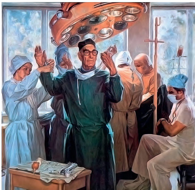
Рис. 507. Портрет академика Л.К. Богуша. Худ. Е.А. Корнеев (1980)

где руки хирурга изображены во время операции. На этой картине они занимают центральное место в композиции, подчеркивая, что в них заключены и успех операции, и жизнь больного (рис. 509). Теме хирургических рук посвящена еще одна картина художницы (рис. 510). На ней изображены только руки хирургов в момент операции, тем самым подчеркивается их особая исключительность. Сюжет этих двух картин заимствован из реальных операций, проведенных во время двухнедельной медицинской миссии иностранными челюстно-лицевыми хирур-