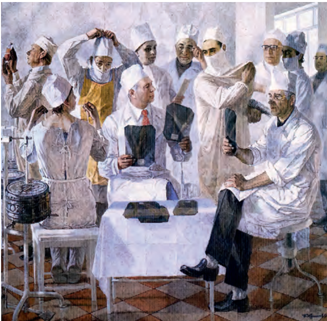
Рис. 502. Ответственные за жизнь. Групповой портрет орловских врачей. Худ. А.И. Курнаков (1980. Орловский музей изобразительных искусств)