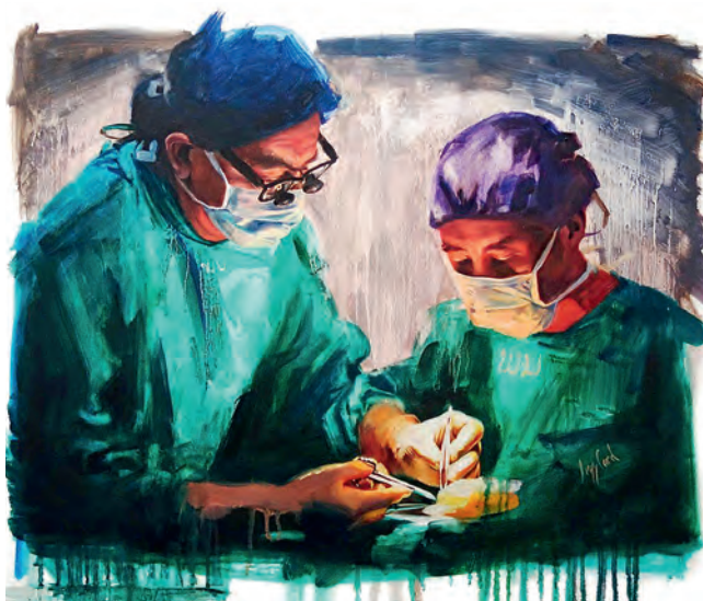
Рис. 509. Врачи-созидатели. «Mahosot Surgery». Худ. Лизз Кард (2015. Lao-Oxford-Mahosot Hospital-Wellcome Trust Вьентьяне, Лаос. https://www.doctorswhocreate.com/author/lizz-card )