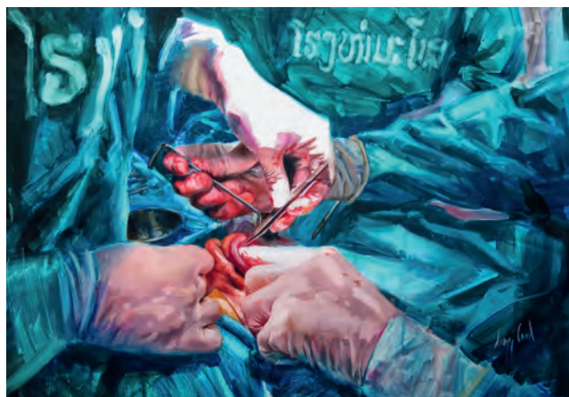
Рис. 510. Руки хирургов. Серия «Mahosot Surgery». Худ. Лизз Кард (2015. Lao-Oxford-Mahosot Hospital-Wellcome Trust Вьентьяне, Лаос. https://www.doctorswhocreate.com/author/lizz-card )