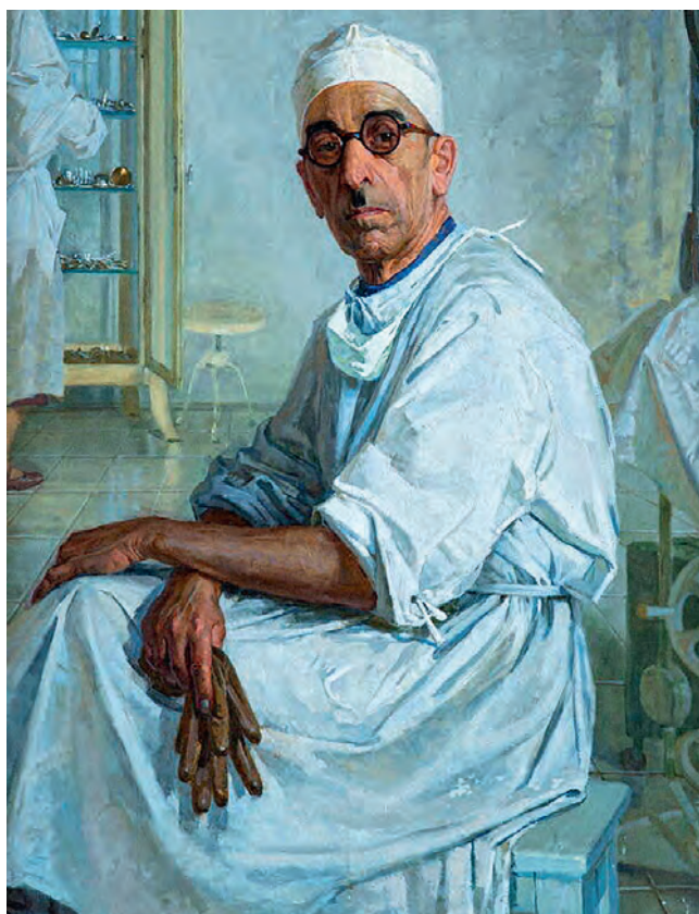
Рис. 499. Портрет заслуженного врача РСФСР А.В. Атабегова Худ. А.И. Курнаков (1956. Орловский музей изобразительных искусств)