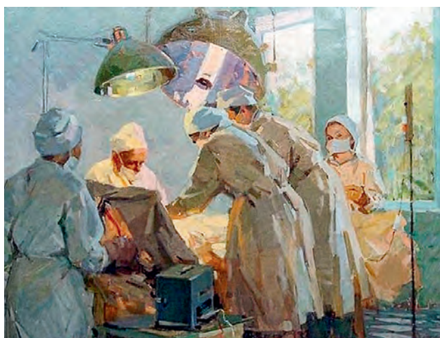
Рис. 494. Сложная операция. Худ. В.А. Данилюк (1950-е гг. Нижегородский государственный художественный музей)