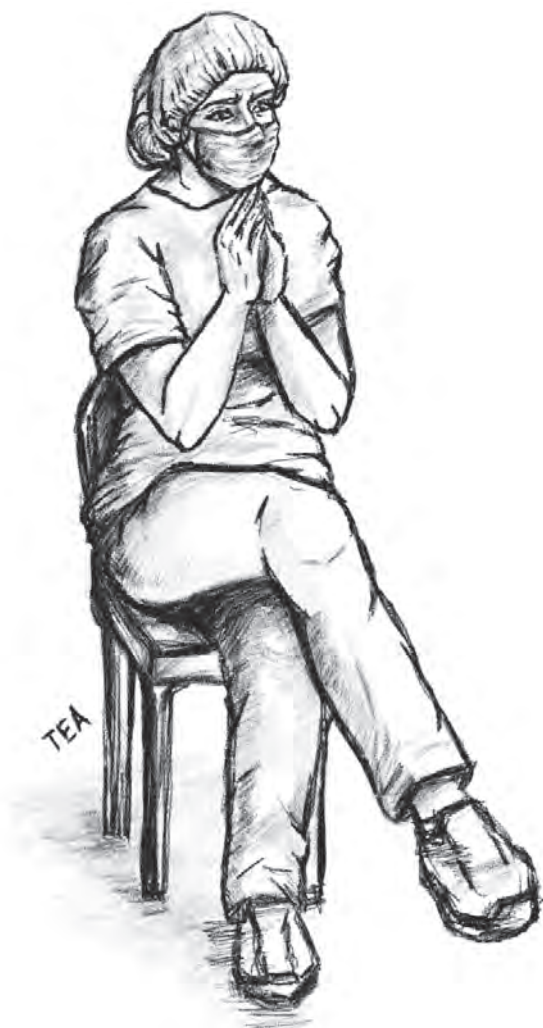
Рис. 491. Молитва перед операцией. Автопортрет. Худ. Е. Ткаченко (2024)

Все эти изменения, пожалуй, ярче всего отразились в медицине. С одной стороны, это бурное развитие таких естественных наук, как биология и химия, приведшее к появлению и развитию таких медицинских наук, как биохимия, цитология, генетика и др. С другой стороны, развитие нового вида наук — технологических, выросших из синтеза науки и промышленного производства, привело к постоянному совершенствованию медицинских инструментов, техники и технологий, как диагностических, так и операционных. Особое влияние на медицину как практическую клиническую деятельность оказало становление и развитие государственных систем здравоохранения, благодаря которым общество и личность стали воспринимать ответственность как государства, так и каждого человека за состояние здоровья. Социальный институт здравоохранения сегодня воспринимается как важнейшая часть государственной политики, а удельный вес медицины в ВВП в развитых странах достигает 10–20%. Это