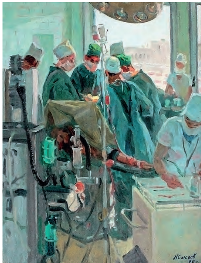
Рис. 498. Идет операция.

Худ. Н.А. Сысоев (1970. Липецкий областной краеведческий музей, http://www.artpanorama.ru/?category=artist&id=1026&show=short )