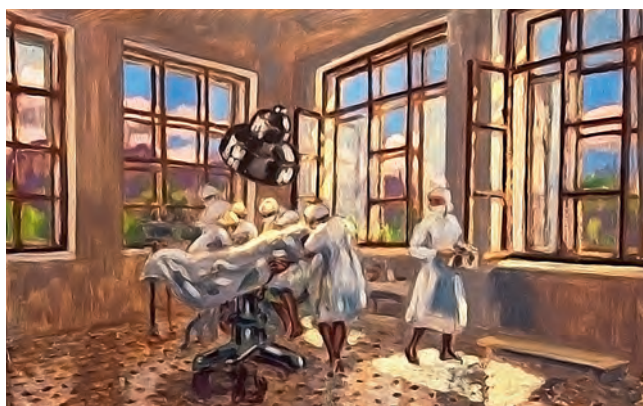
Рис. 495. Хирургическая операция. Худ. Д.Н. Никитин-Яковлев (1940. Березниковский историко-художественный музей им. И.Ф. Коновалова)

дет успешной. Полная противоположность читается в произведении художника Д.Н. Никитина-Яковлева ( рис. 495 ): апогей операции преодолен, она явно удалась, и это видно по расслабленным позам членов операционной бригады.