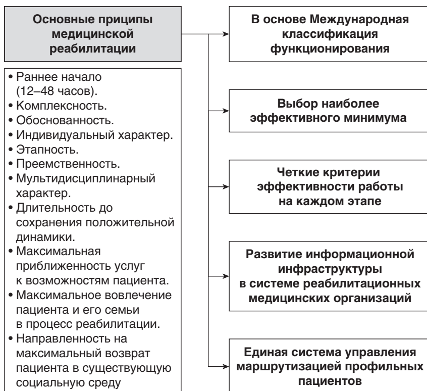
Рис. 1.2. Основные принципы медицинской реабилитации

Основные принципы медицинской реабилитации заключаются в следующем (рис. 1.2):