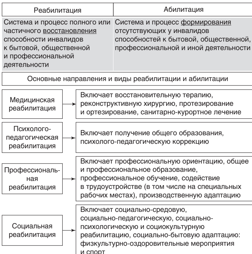
Рис. 1.1. Основные направления и виды реабилитации и абилитации

При этом, если абилитация рассматривается как совокупность мероприятий, применяемых для становления и развития физического, личностного и социального статуса пациентов при врожденных и приобретенных в раннем детстве патологических состояниях, то реабилитация трактуется с позиций восстановления (возвращения к исходному состоянию) физического, личностного и социального статуса при заболеваниях, возникших у пациентов остальных возрастных групп (рис. 1.1).