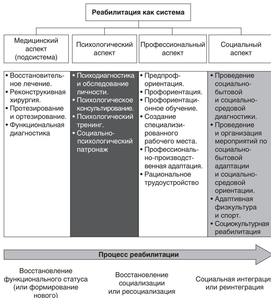
Рис. 1.3. Виды реабилитации

В настоящее время различают четыре основных вида реабилитации — медицинская, физическая, психосоциальная и профессиональная (рис. 1.3).