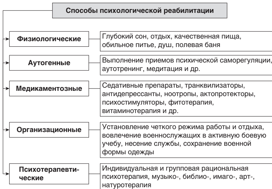
Рис. 1.5. Способы (методы) психологической реабилитации

(психологических) функций и коррекцию социального статуса лиц с ограниченными возможностями. Психологическая реабилитация проводится в тесном единстве с медицинской, профессиональной и социальной реабилитацией (рис. 1.5).