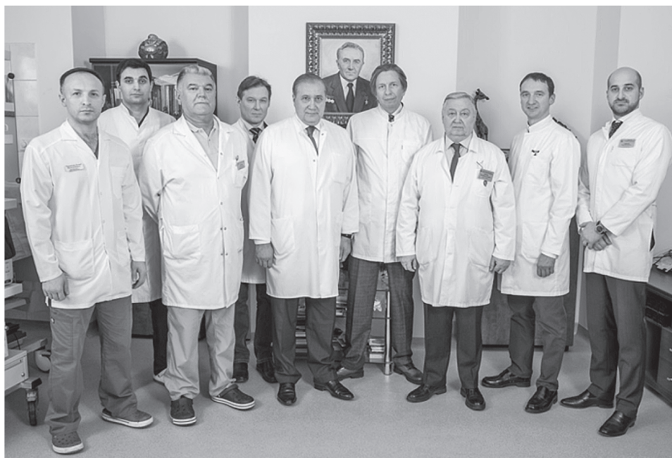
Рис. 2. Коллектив кафедры урологии и андрологии МГУ им. М.В. Ломоносова и урологического отделения ГБУЗ «ГКБ № 31 им. акад. Г.М. Савельевой ДЗМ»

Департамента здравоохранения г. Москвы были внедрены и широко применяются в клинической практике рентгенэндоваскулярные методы диагностики и лечения урологических заболеваний ( рис. 2 ).