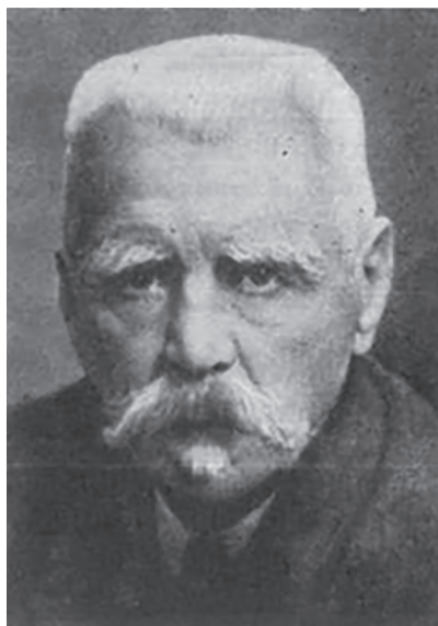
Г.И. Турнер (1858–1941)