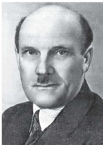
Н.Н. Приоров (1885–1961)