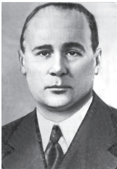
Т.С. Зацепин (1886–1953)