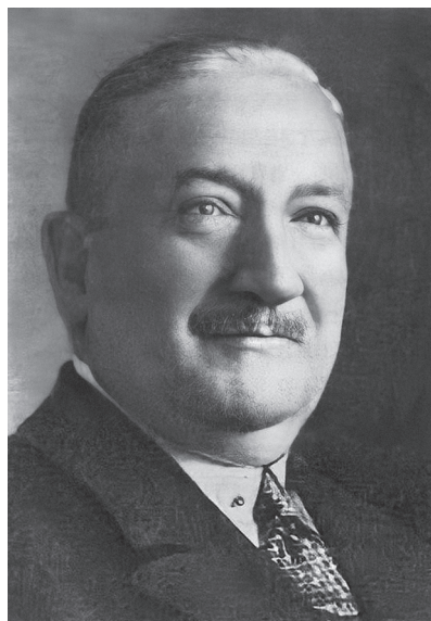
Р.Р. Вреден (1867–1934)