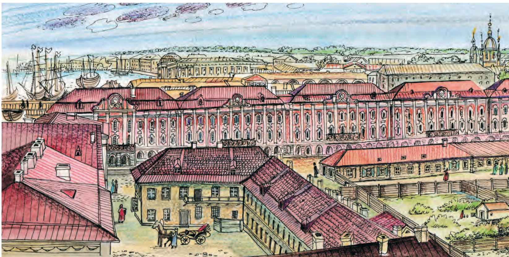
Здание Двенадцати коллегий

иллюминацию, с Петропавловской крепости и Адмиралтейства раздавалась пушечная пальба, звучала музыка.