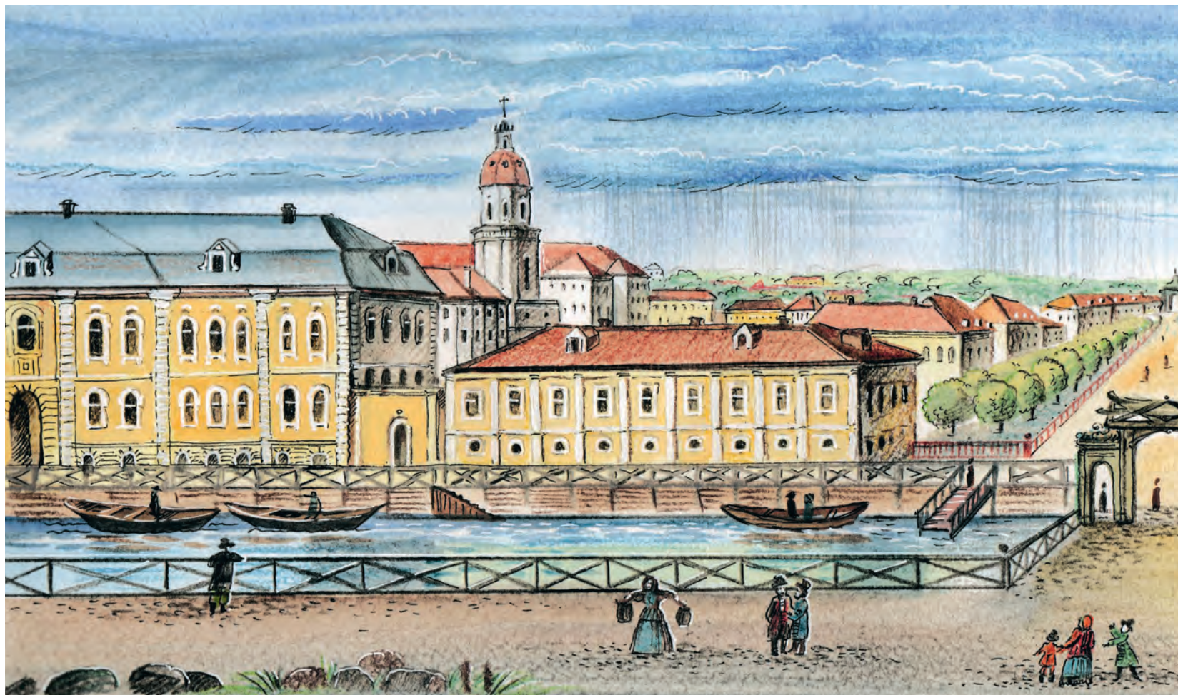
Так выглядел в XVIII веке Невский проспект

Царь ввёл также «каменный налог»: каждый въезжавший в город на телеге должен был привезти три камня весом около двух килограммов, а те, кто приплывал на судах, — от десяти