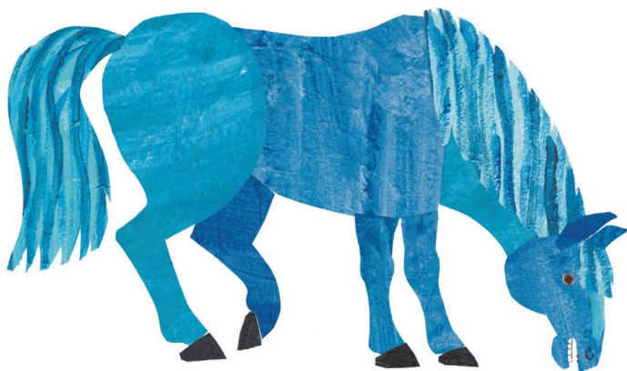
— Синяя лошадка, кто там впереди?

С «Мишки...» и началось наше «чтение». Фиолетовый кот, синяя лошадка, зеленая лягушка... Казалось бы, что там читать? На самом деле это неважно. Главное — повторяющийся ритм, который сопровождает понятные и однообразные движения ребенка.