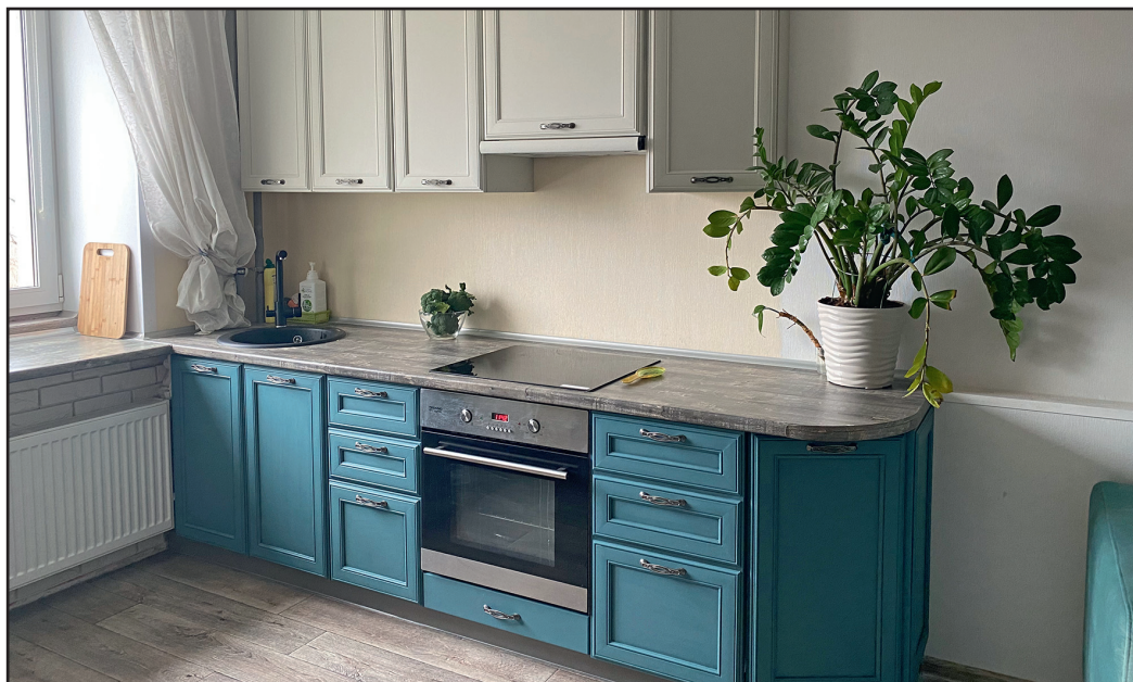
Та же кухня после глобального редизайна