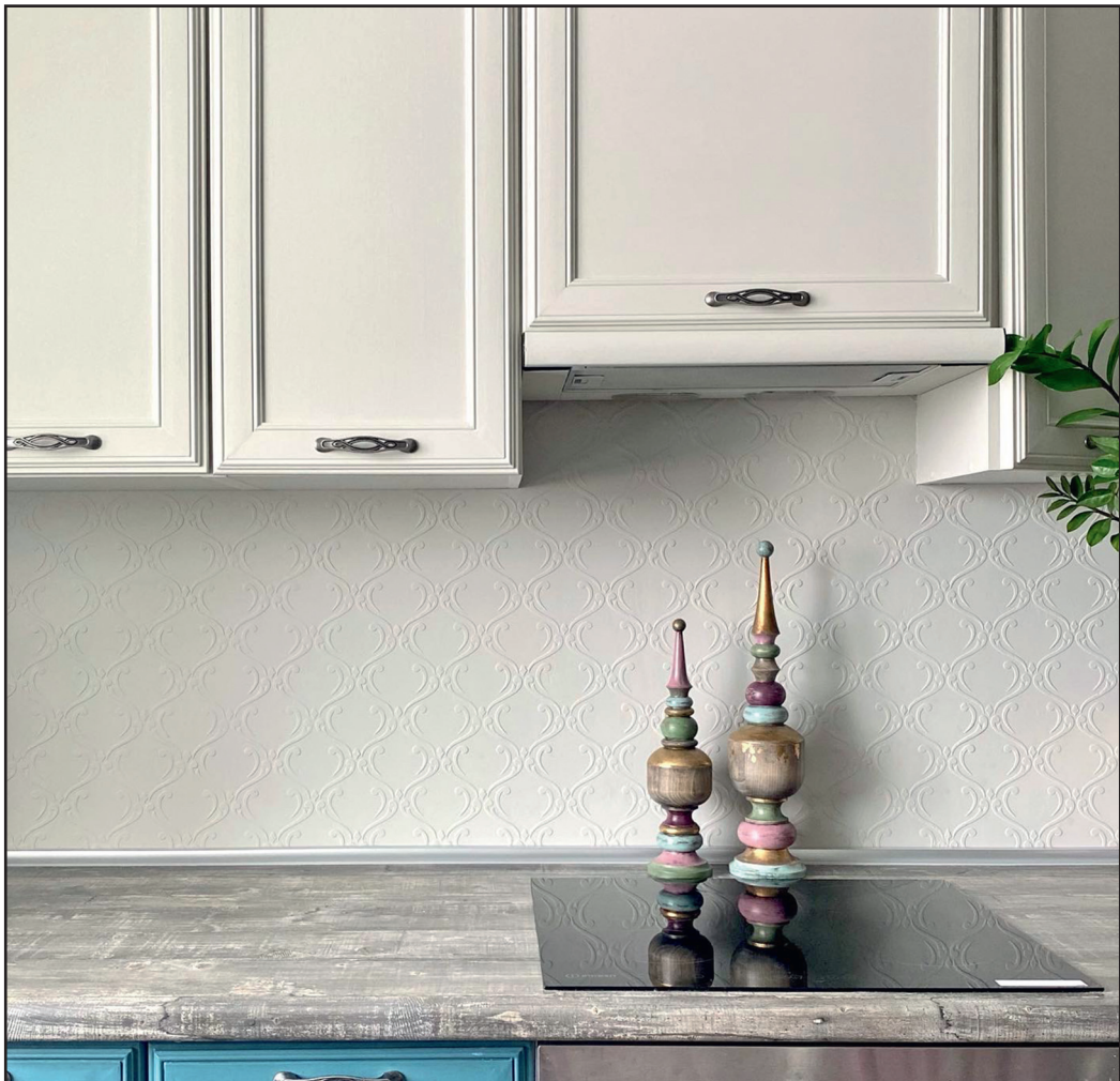
Кухонный фартук в технике рельефного рисунка через трафарет

нарастила часть шкафчиков ввысь, декорировала скучные плоские фасады молдингами и покрасила в благородные сине-белые цвета. Заодно под кисть попали холодильник и кухонный фартук. Получилось до неузнаваемости и очень красиво — как раз то что надо.