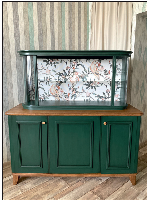
Сервант советской эпохи после до и после редизайна