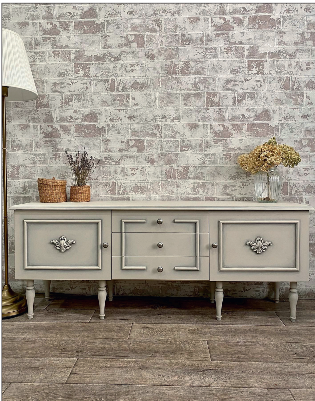
Консоль из болгарского гарнитура «Милена» 1980-х годов после редизайна