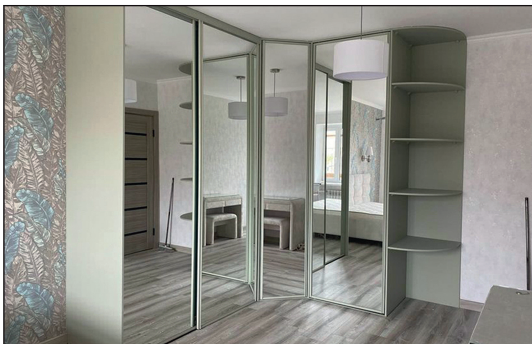
Он же после перекраски в современный цвет