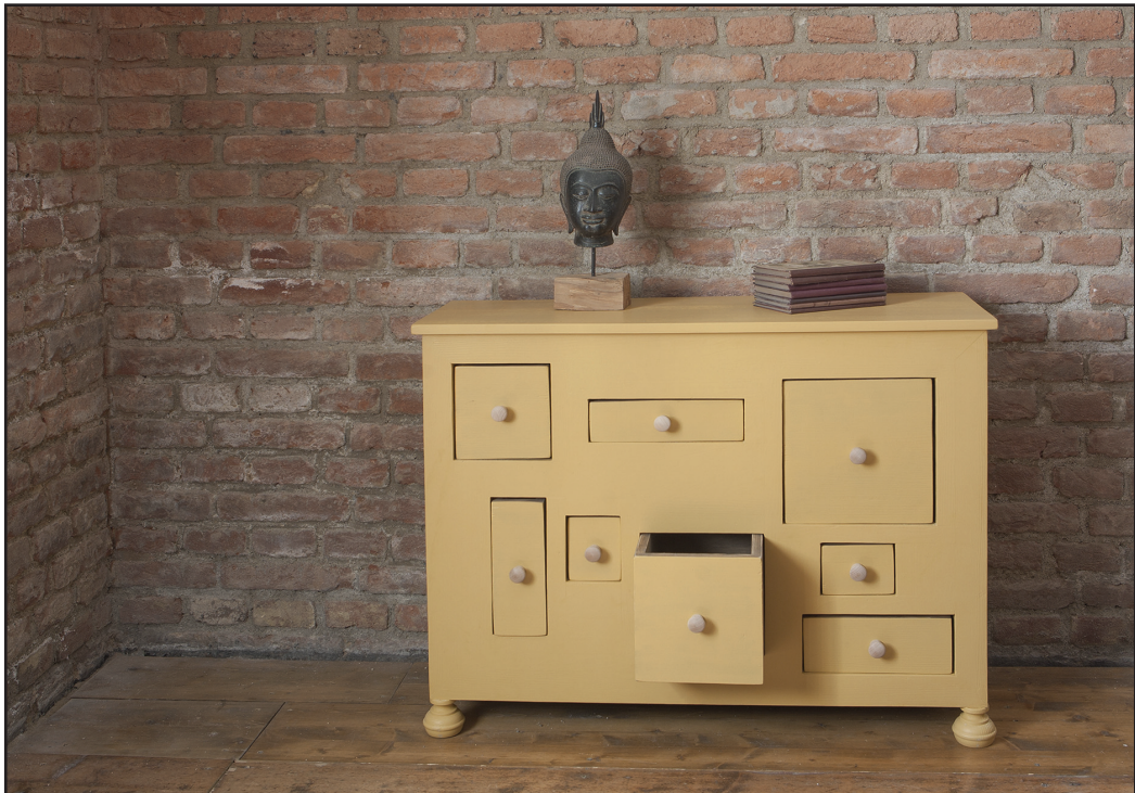
Любую мебель можно перекрасить так, чтобы было красиво

Не все догадываются, что красить можно дома, и даже с детьми, и даже с закрытыми окнами. Мебельные краски нового поколения в подавляющем большинстве на водной основе, то есть в процессе работы испаряется из краски вода. А едкие токсичные испарения, так