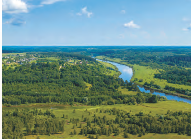
Вид с воздуха на реку Угру и Национальный парк «Угра».

Этот парк — не просто природная достопримечательность, а известный в мире биосферный резерват ЮНЕСКО. Он расположен на землях междуречья Оки, Жиздры и Угры. Площадь заповедника — почти 100 га. Здесь собраны разные виды лесов, лугов, озер с многочисленными обитателями, включая русскую выхухоль и белого аиста. Вы сможете посетить более 20 памятников природы и истории: урочище «Чертово городище», бор на дюнах, пойменные озера и другие. Любителям истории тоже не будет скучно — здесь можно увидеть место «Великого стояния» 1480 г. и капища балтских племен, фортификационные укрепления XVII в. и еще с десятком крупных памятников истории и архитектуры. Гости региона, как и местные жители, отзываются о парке как об одном из лучших мест для отдыха.