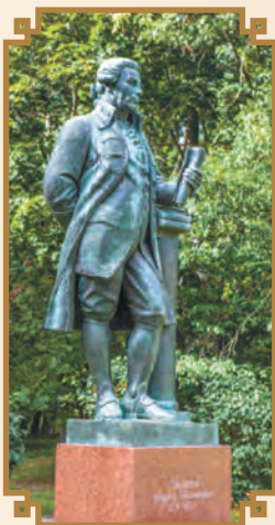
Фото памятника Андрею Тимофеевичу Болотову в пейзажном парке. Богородицкий дворцово-парковый ансамбль. Богородицк, Россия. 3 сентября 2021 г.

К обустройству этого роскошного «дворянского гнезда» приложил руку выдающийся ботаник и лесовод, писатель и мемуарист Андрей Тимофеевич Болотов. Будучи человеком, который основал в Российской империи агрономию, обладая широчайшими познаниями в ботанике и лесоводстве, Болотов спроектировал и претворил в жизнь в Богородицком имении первый в истории страны пейзажный парк. Его трудами окрестные места совершенно преобразились: здесь были созданы и каскадные пруды, и водопады, высаживалось огромное количество разнообразных деревьев. Теперь на территории парка установлен памятник А. Т. Болотову!