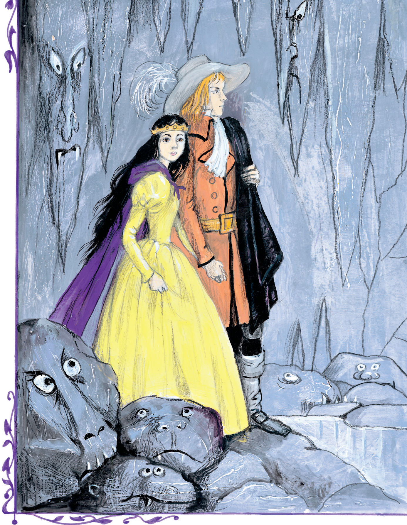
Рисунки А. Власовой