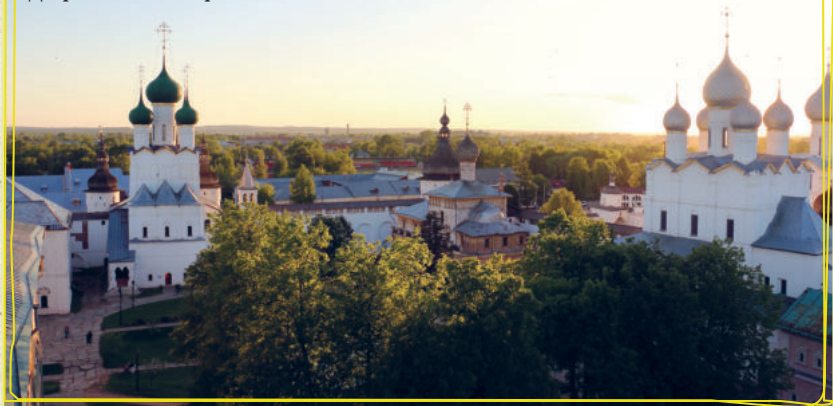
Двор Ростовского кремля