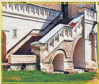
Крыльцо Белой палаты

• Любителям церковных древностей — в сени Белой палаты . С 1993 года здесь экспозиция, созданная как реконструкция ростовского Музея церковных древностей, существовавшего с 1883 года до начала 1920-х. Иконопись, резьба по дереву, живопись, утварь, оружие, книги, документы, фотографии и декоративно-прикладное искусство.