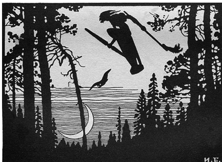
Рисунок И.Я. Билибина