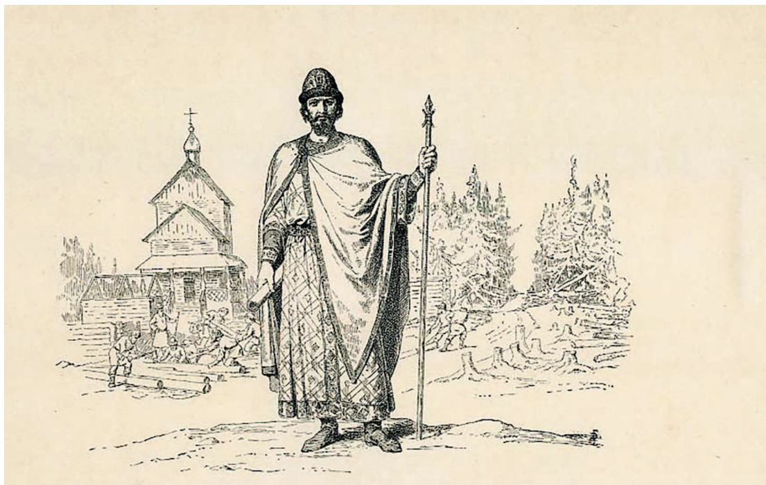
В. П. Верещагин. Юрий Долгорукий. Иллюстрация из альбома «История государства Российского в изображениях державных его правителей». 1896 г.

если в 1147 году Юрий Долгорукий уже приглашает туда своих соратников?