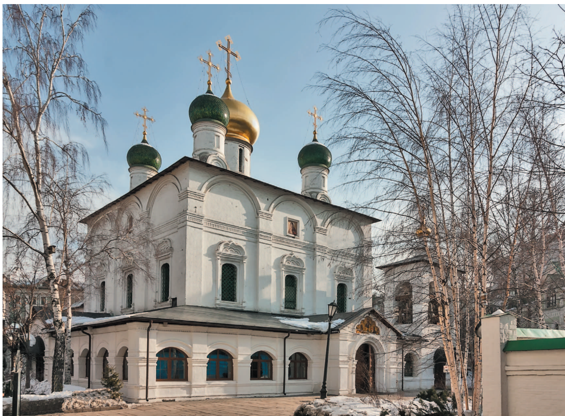
На месте Кучкова поля в XIV столетии в память избавления Москвы от нашествия Тамерлана был основан Сретенский монастырь

И сама Москва, и близлежащие селения, и прилегающие земли до Юрия Долгорукого принадлежали суздальскому боярину Степану Кучке (Кучко). До сих пор один из районов Москвы рядом с Лубянской площадью именуется Кучковым полем, хотя ни на одной