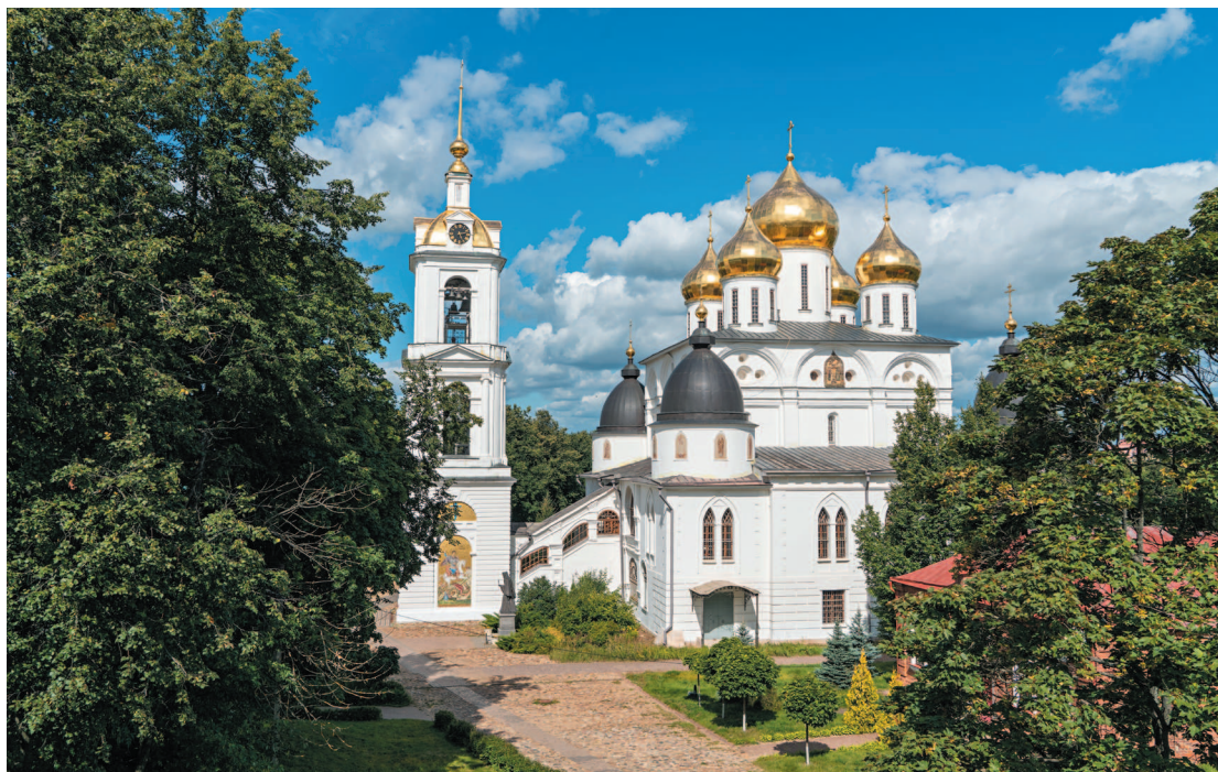
Успенский собор на территории Дмитровского кремля. Дмитров — один из городов, основанных Юрием Долгоруким

Кстати, зачем он их приглашал? В летописях упоминается некий «обед силен». Так что это могли быть празднества в честь очередной победы над политическими соперниками или просто дипломатическая встреча с целью обсуждения дальнейших действий. Вполне возможно, что Юрий Долгорукий уже тогда рассматривал Москву как вероятный политический центр — если не всей Руси, то своих собственных