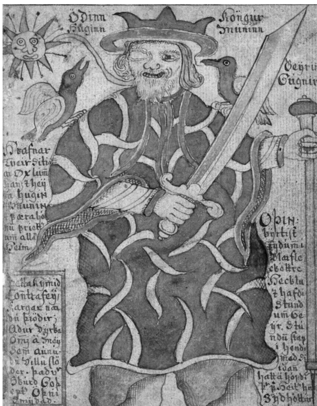
Один. Иллюстрация из исландской рукописи XVIII века

Но нет ли какой-нибудь более «приземленной» версии происхождения рун? Долгое время историки и филологи отталкивались от их странной формы — угловатой, геометрической, и старались найти аналогии в самых разных древних языках. Но впоследствии возникла гипотеза, что, возможно, «предки» германских рун выглядели несколько иначе, просто жители