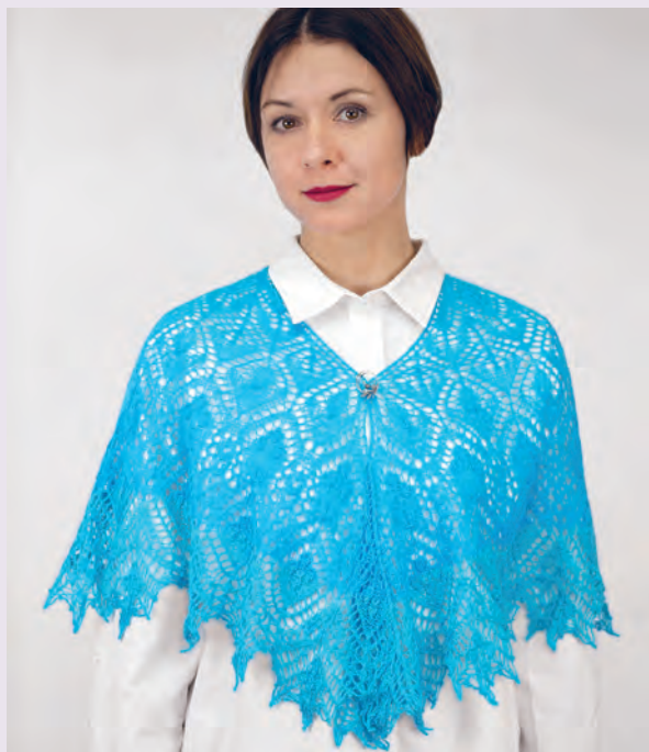
Летняя кадиль 63