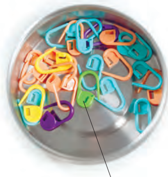
маркеры для вязания

раппорта или первый ряд узора, место прибавления и убавления петель. Они бывают разной конструкции: в виде колец и подвесок, разъемные и неразъемные. Я часто применяю самые простые разъемные маркеры, чтобы отметить начало и конец раппортов или выделить центральный мотив шали. Вместо них можно взять отрезок нити контрастного цвета, английскую булавку или канцелярскую скрепку.