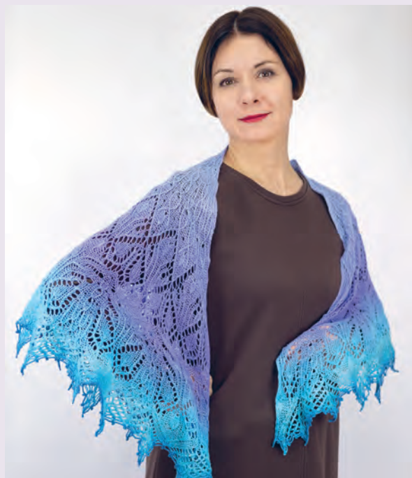
Сады Семирамиды 75