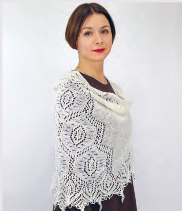
Горный хрусталь 133