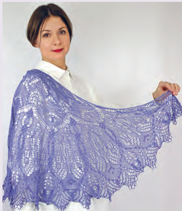
Шамаханская царица 103