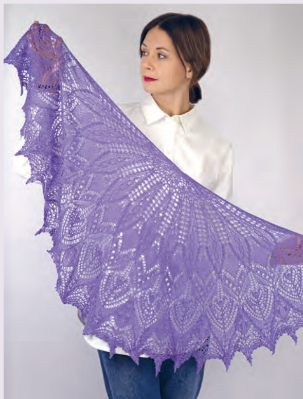
Ночная фиалка 163