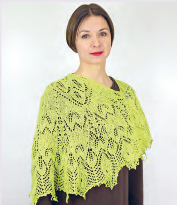
Восточная Принцесса 89