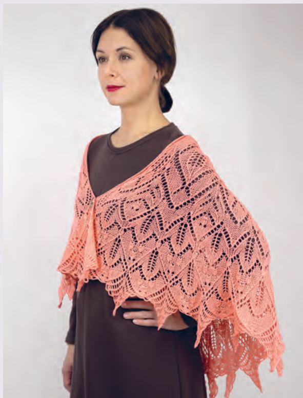
Прелестная Колумбина 147