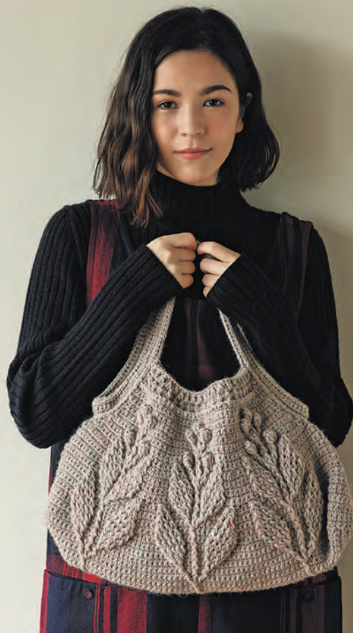
Зимняя сумка. Добавьте нюансов с помощью меланжевой пряжи