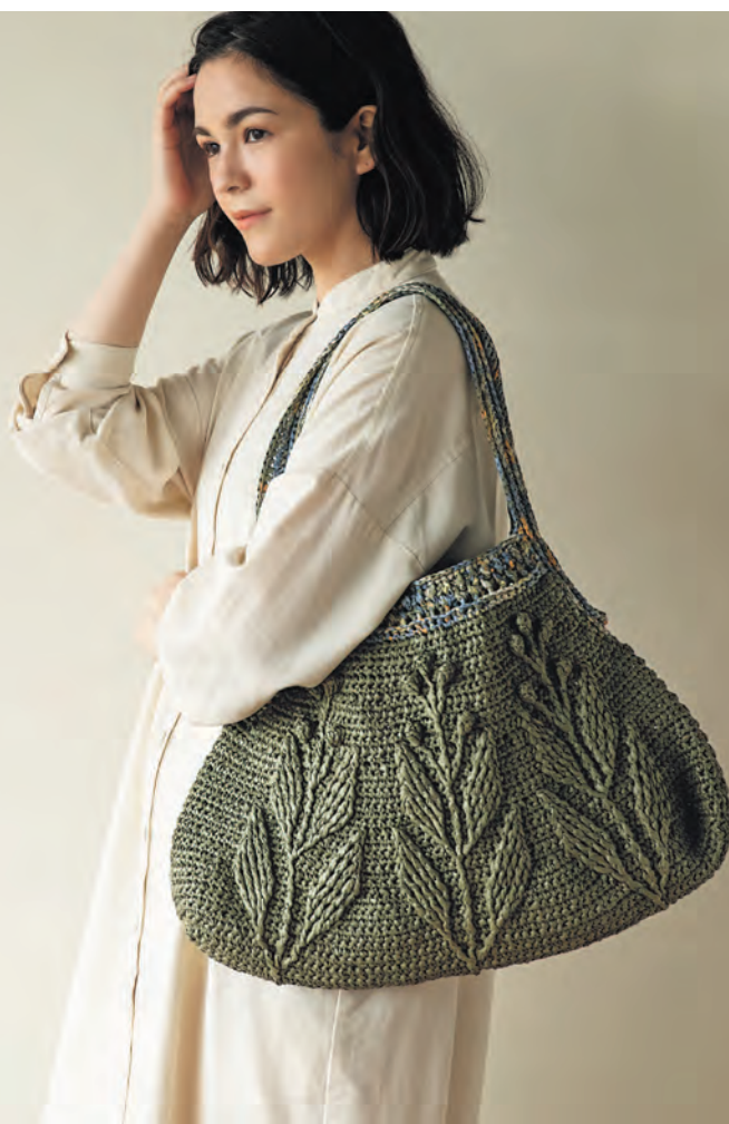
Летняя сумка. Акцент на многоцветной ручке