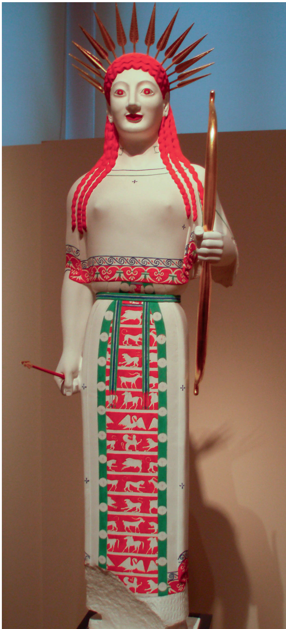
ПОЛИХРОМНАЯ РЕКОНСТРУКЦИЯ КОРЫ

Сколько бы нюансов ни таили в себе курсы и коры, их появление стало важным шагом в развитии древнегреческого искусства. Мастера архаики освоили анатомию, научились изображать базовые телодвижения, что стало первой ступенью на пути к очеловечиванию греческой скульптуры.