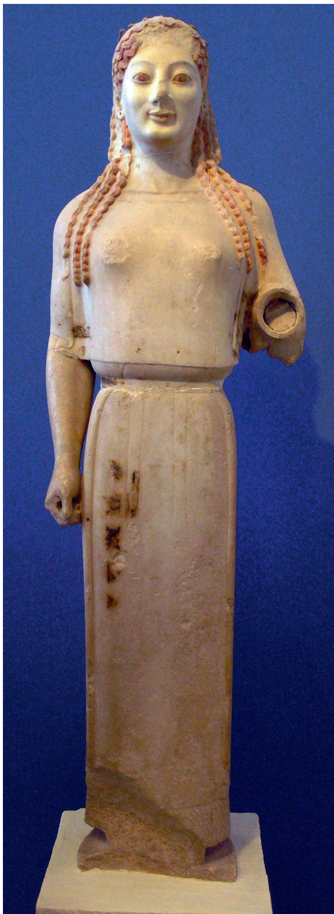
«КОРА В ПЕПЛОСЕ» ОК. 530 Г. ДО Н.Э. НОВЫЙ МУЗЕЙ АКРОПОЛЯ, АФИНЫ

Вторым типом скульптуры архаики стала кора. В ее теле сохраняется та же напряженность, что и у курса, но дева выглядит более естественно благодаря различным деталям: украшениям на голове, задрاپированной одежде, доходящей до пола. Кроме того, ее руки неплотно прилегают к телу. Известно, что одной рукой коры зачастую придерживали одежды или же просто что-то в ней держали.