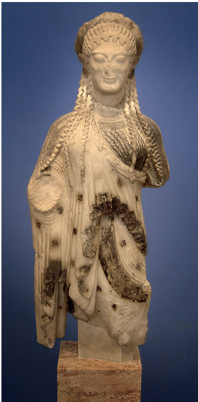
СКУЛЬПТОР АРХЕМОС «ХИОССКАЯ КОРА» 520-510 ГГ. ДО Н.Э. МУЗЕЙ АФИНСКОГО АКРОПОЛЯ

Вторым типом скульптуры архаики стала кора. В ее теле сохраняется та же напряженность, что и у курса, но дева выглядит более естественно благодаря различным деталям: украшениям на голове, задрاپированной одежде, доходящей до пола. Кроме того, ее руки неплотно прилегают к телу. Известно, что одной рукой коры зачастую придерживали одежды или же просто что-то в ней держали.