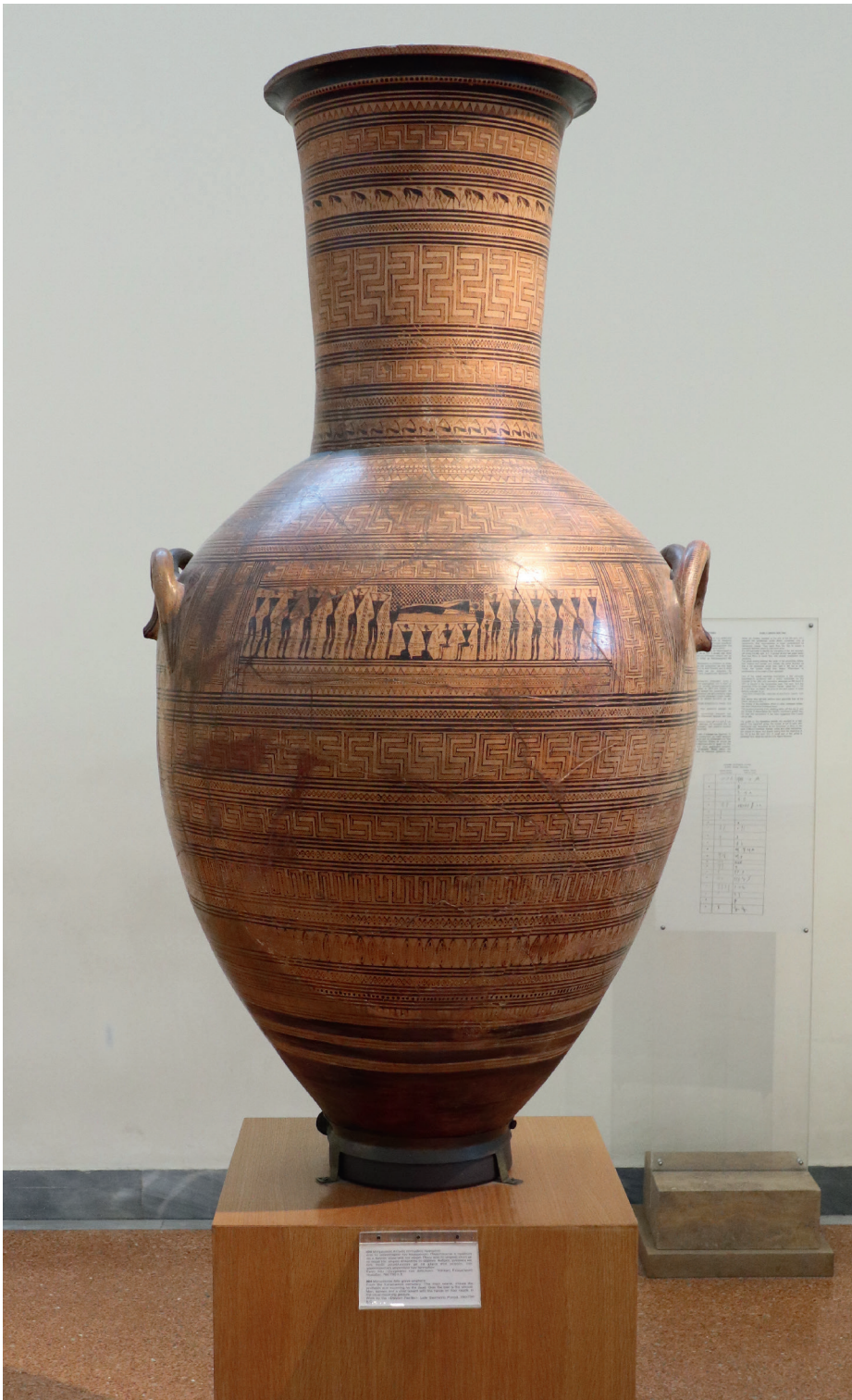
ДИПИЛОНСКАЯ ВАЗА 760-750 ГГ. ДО Н.Э. НАЦИОНАЛЬНЫЙ АРХЕОЛОГИЧЕСКИЙ МУЗЕЙ, АФИНЫ

Чем больше люди делали подобных сосуды, тем сложнее становился рисунок. Наивысшей точкой гончарного дела того времени стали дипилонские амфоры — огромные, с человеческий рост, сосуды, на которые наносилась целая система знаков. Название они получили по месту, где были обнаружены.