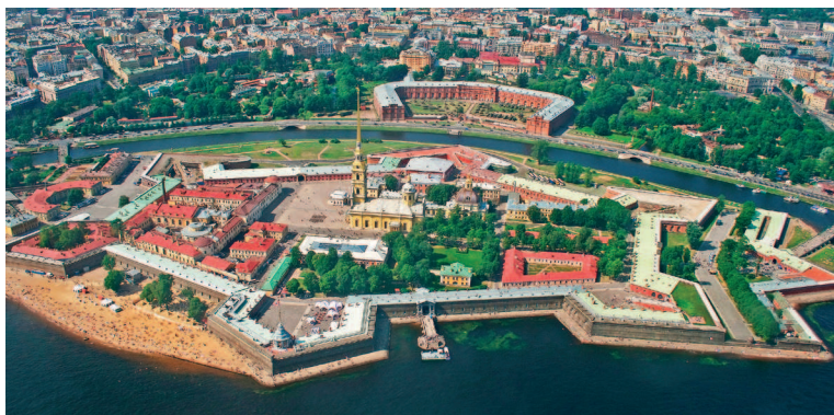
▲ Вид на Петропавловскую крепость с высоты. Хорошо видны бастионы. Полоса берега была «досыпана» позже, первоначально стены вырастали практически прямо из воды

Постепенно крепость стали называть Петропавловской (по названию церкви, которая тогда еще не превратилась в огромный собор с позолоченным шпилем), а Санкт-Петербургом начали именовать город, строившийся под ее защитой.