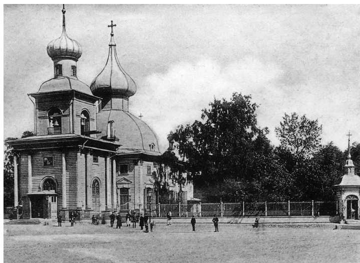
▲ Церковь Святой Троицы (Троицкий собор) на фото 1890-х годов

Известно, что Петр, если был в Петербурге, часто присутствовал на богослужениях в Троицком соборе и даже пел на клиросе. Более того, он изготовил для храма светильник-паникадило из бронзы и слоновой кости, а также коробочки для ладана. Храм особо отличали многие наши правители: например, императрица Елизавета для него собственноручно вышила на престольную сень.