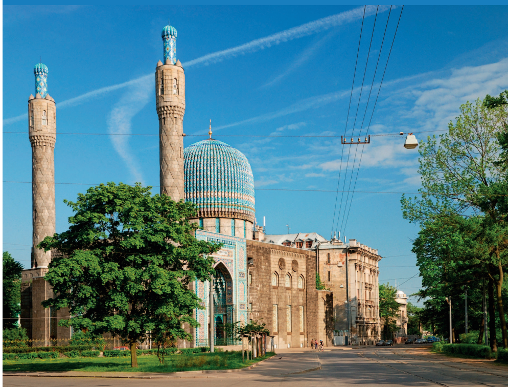
▲ Петербургская соборная мечеть, находящаяся неподалеку от Троицкой площади