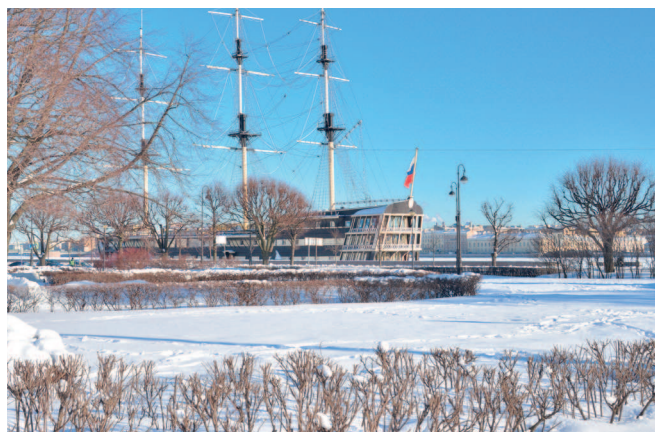
▲ Современная Троицкая площадь зимой. У берега стоит фрегат-ресторан «Благодать»

В непосредственной близости от площади, рядом с избушкой Петра, возвели для себя временные хоромы воспитатель Петра Никита Зотов, его ближайший соратник Александр Меншиков, военачальник Иван Бутурлин и другие. За храмом протянулись ряды Гостиного двора, где заморские гости и собственно петербуржцы могли торговать; для продажи продовольствия предназначались так называемые Обжорные ряды, расположенные здесь же. На берегу располагалась таможня, в глубине площади — еще одно совершенно необходимое учреждение: трактир «Аустерия четырех фрегатов», где Петр иногда пропускал рюмочку чего-нибудь согревающего или играл в шахматы со своими сподвижниками. Там же иногда проводились ассамблеи.