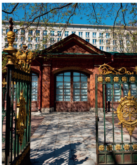
▲ Домик Петра I неподалеку от Троицкой площади

Домик Петра сохранился до наших дней и сейчас представляет собой музей. Для лучшей сохранности избушку накрыли каменным «футляром».