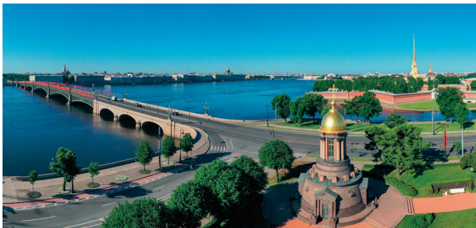
▲ Троицкая площадь и въезд на Троицкий мост

В 1730-х годах, когда многие административные учреждения уже перенесли на Васильевский остров, значение Троицкой площади начало снижаться. Но внешне она менялась довольно медленно. Даже Троицкий собор все время своего существования оставался совсем небольшим и очень скромным внешне, впрочем, у этого была причина — хотели сохранить облик, характерный для петровского времени.