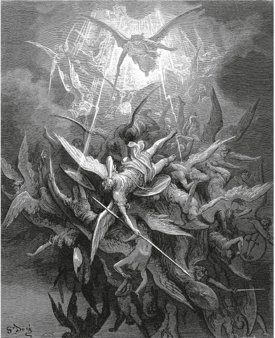
...Вседоуцый Бог Разгневаный стрелглав низверг строптивцев...