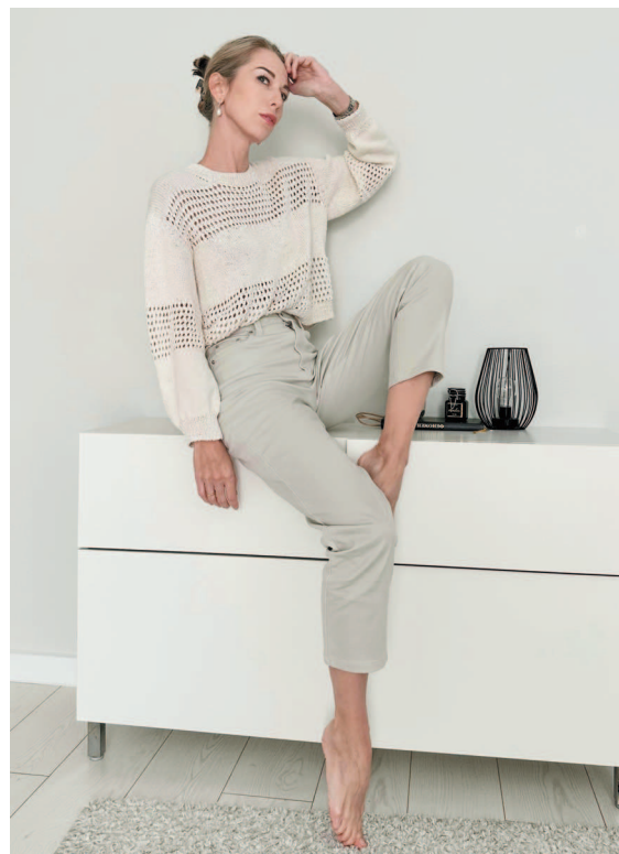
Рис. 3. НЕ контрастные цвета

Добавляя дополнительный цвет, нужно понимать, насколько это оправданно в дан- ном образе. Брюки перекликаются с цветом одной из полосок на джемпере, например (Рис. 4).