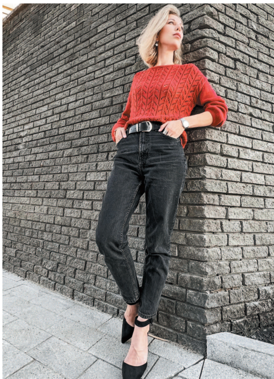
Рис. 2. Высокие контрасты

В таком комплекте одежда служит фоном, а аксессуары — акцентом.