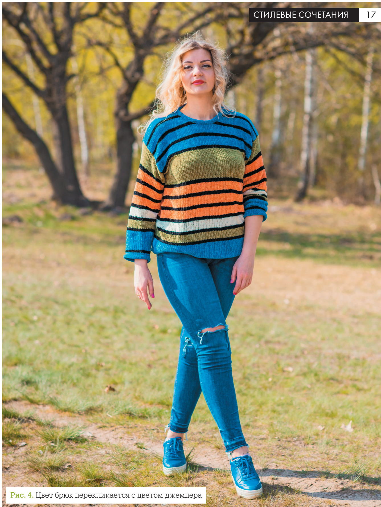
Рис. 4. Цвет брюк перекликается с цветом джемпера