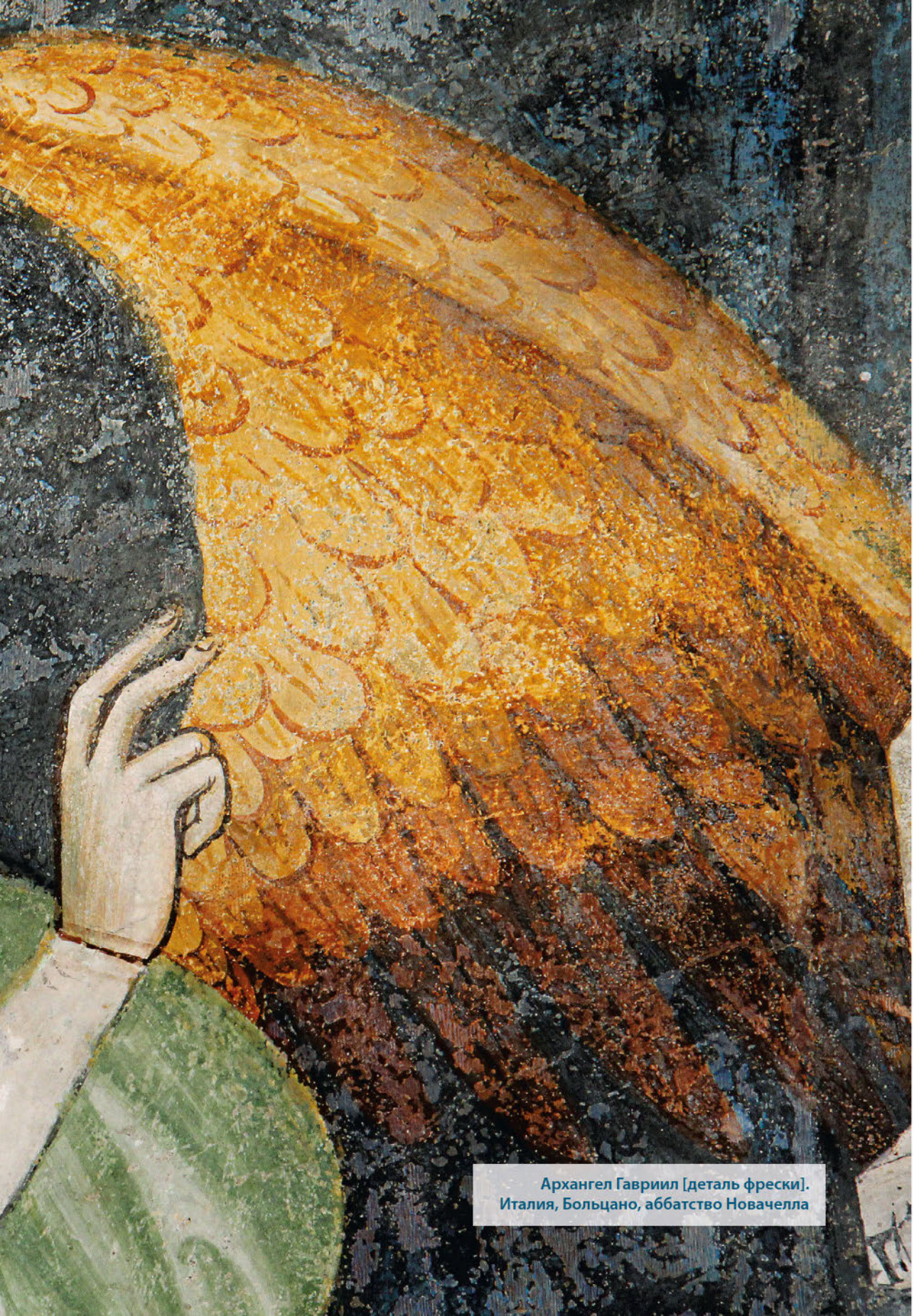
Архангел Гавриил [деталь фрески]. Италия, Больцано, аббатство Новачелла