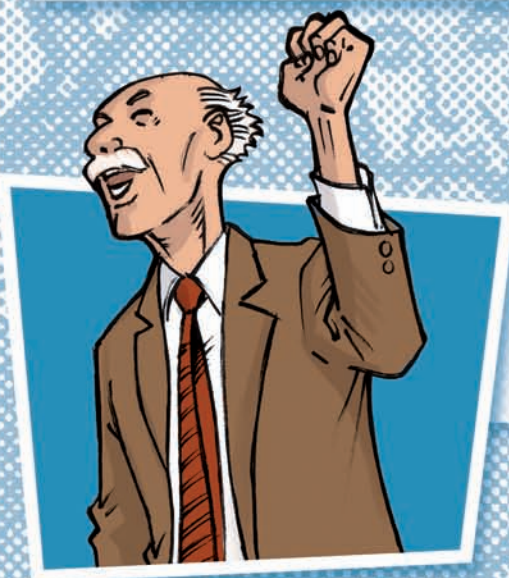
Il padre di Mauro