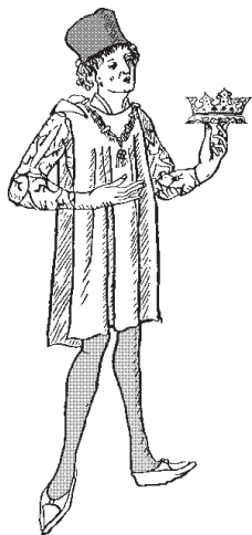
principe: figlio del re

mercante: uomo d'affari del tempo antico, commerciante, venditore.