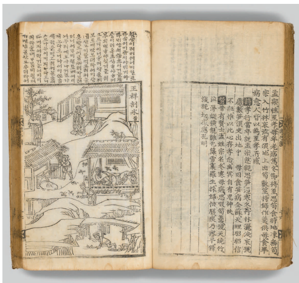
Рис. 1. Самганхэнсильдо . Ксилография. 23,5 × 37,5 см. Национальный музей Республики Корея, Сеул

деятель своего времени, художник-интеллектуал Кан Хиан (강희안, 1417–1464) завещал детям и внукам не увлекаться искусством, так как «живопись — занятие низкое, и, если потомки узнают об увлечении рисованием, добрым словом не помянут» 3 . По этой же причине не приветствовалось