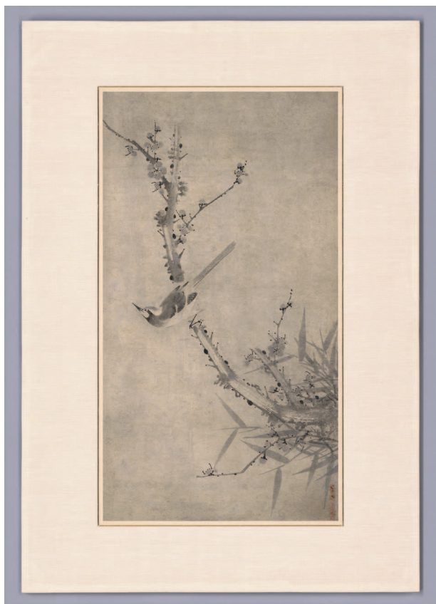
Рис. 2. Чо Сок (조속, 1595–1668). Птица на ветке сливы . XVII в. Бумага, тушь, 83,3 × 46,1 см. Национальный музей Республики Корея, Сеул