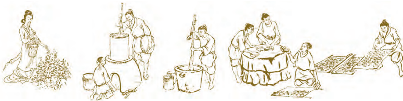
Иллюстрации из «Чайного канона»

Танский государь Дай-цзун пытался назначить Лу Юя настоятелем монастыря Тайшансы или учителем литературы наследного принца. Но в обоих случаях Лу Юй не явился на службу. Не ценил он ни власть, ни знатность, не уделял внимания богатству, любил природу и твердо придерживался справедливости.