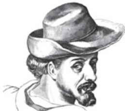
Miguel de Cervantes

a. Relaciona estos personajes famosos con su lugar de nacimiento y su obra representativa o importancia en el panorama español. Busca más información en Internet sobre dos de estos personajes y coméntalo con tus compañeros.