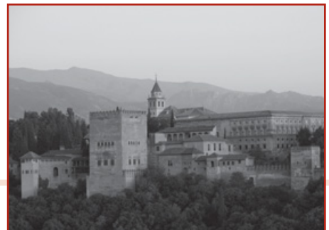
La Alhambra de Granada

7. ¿Qué zona de España fue la más visitada por los turistas en el 2011?