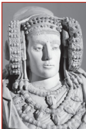
La Dama de Elche

Antes de la llegada de los romanos en la Península había varios pueblos y culturas con diferentes orígenes y características.