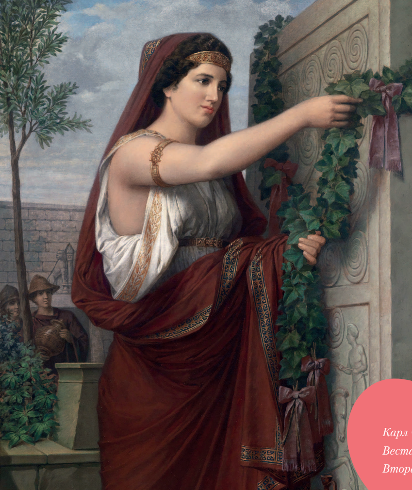
Карл Фридрих Деклер. Весталка с гирляндой из piazza. Вторая половина XIX века. Частное собрание