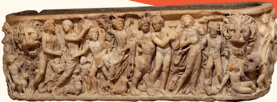
Часть саркофага с изображением дионисийского шествия. Рим, около 195–200. Музей искусств округа Лос-Анджелес

Дионис почитался в Древней Греции как бог — покровитель виноградарства, виноделия и веселья. Впрочем, виноградная лоза стала атрибутом Диониса не сразу — первоначально он почитался как божество «производящих сил» и плодородия и часто изображался в образе быка. Благодаря Дионису в Греции родилось искусство театра — вернее, выросло из веселых шествий в его честь.