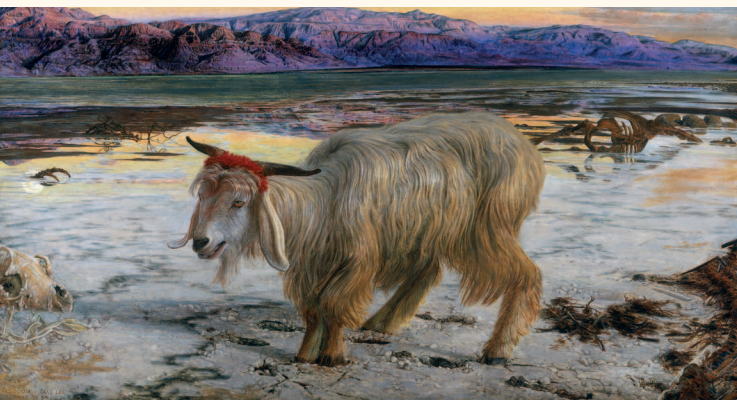
Уильям Холман Хант. Козел отпущения. 1854. Художественная галерея леди Левер, Порт-Санлайт

ПОСТ В ЙОМ-КИПУР ОБЫЧНО НАЧИНАЕТСЯ ВЕЧЕРОМ НАКАНУНЕ ТОРЖЕСТВЕННОГО ДНЯ НЕЗАДОЛГО ДО ЗАХОДА СОЛНЦА И ЗАВЕРШАЕТСЯ ВЕЧЕРОМ ЭТОГО ДНЯ ПОСЛЕ ПОЯВЛЕНИЯ НА НЕБЕ ЗВЕЗД.