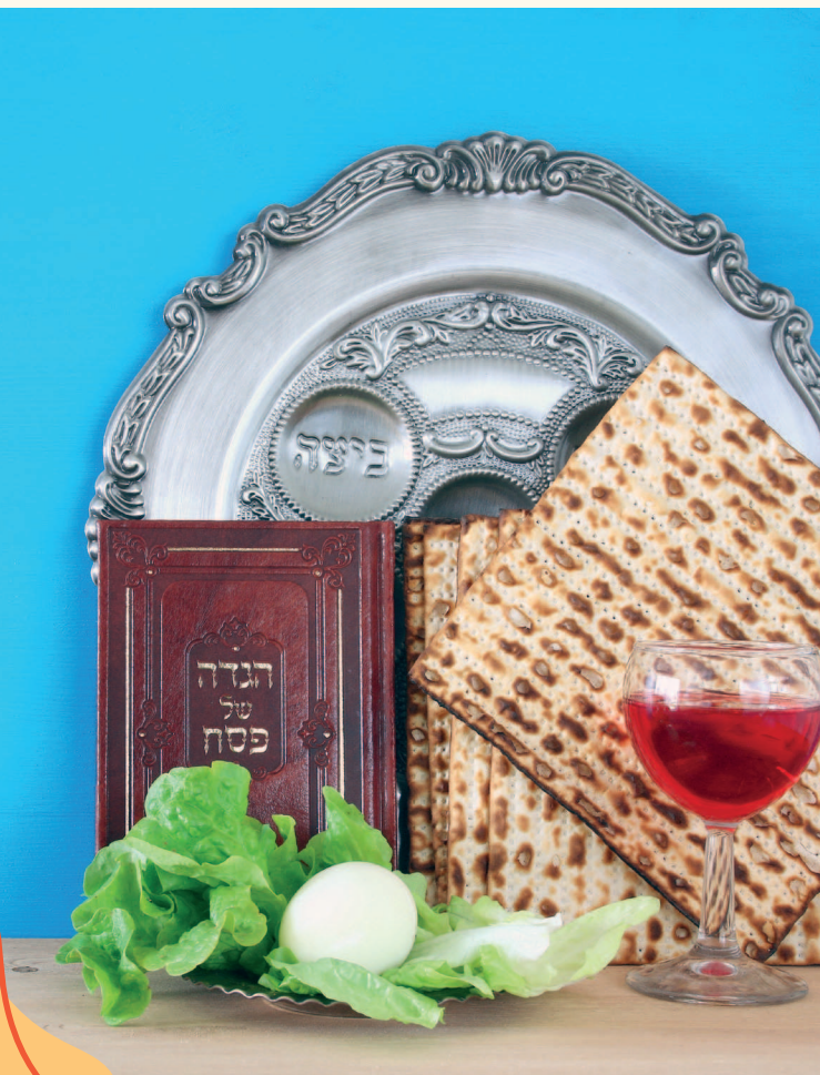
Атрибуты Песаха: кеара, сборник священных текстов, бокал с вином, маца, листья салата, яйцо

В евангельских преданиях говорится, что именно во время пасхальной трапезы (которую потом стали именовать Тайной вечерей) Иисус предсказал своим ученикам, что один из них предаст его... Именно тогда Спаситель сравнил себя с жертвенным агнцем и, благословляя вино, наименовал его своей кровью. Но в христианской традиции Пасха связана уже с воскресением Иисуса Христа, о теме Исхода евреев лишь отчасти напоминают библейские тексты, читаемые во время богослужений.