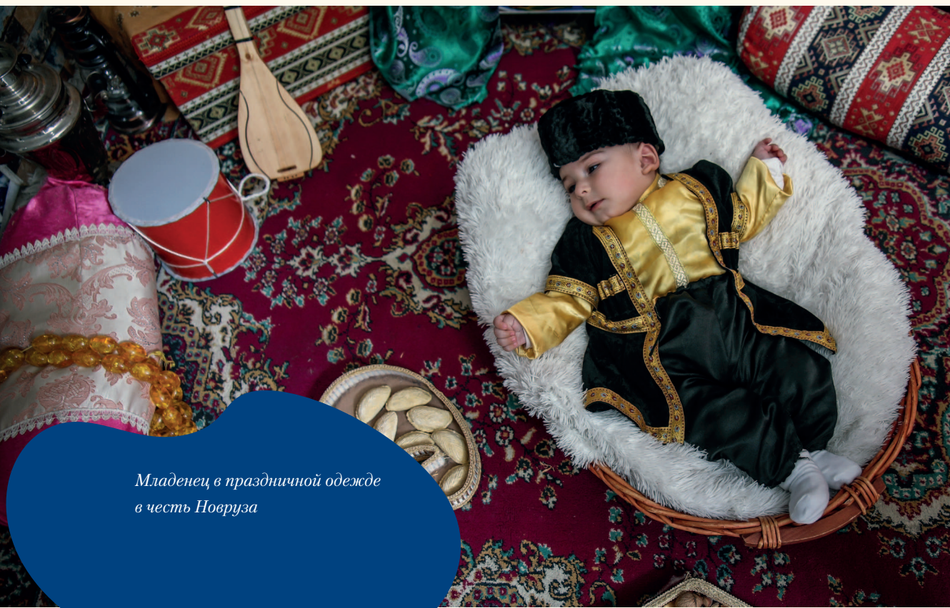
Младенец в праздничной одежде в честь Новруза

Этот праздник отмечается в Азербайджане и Казахстане, Туркменистане, Киргизии, Афганистане, Иране и других странах.