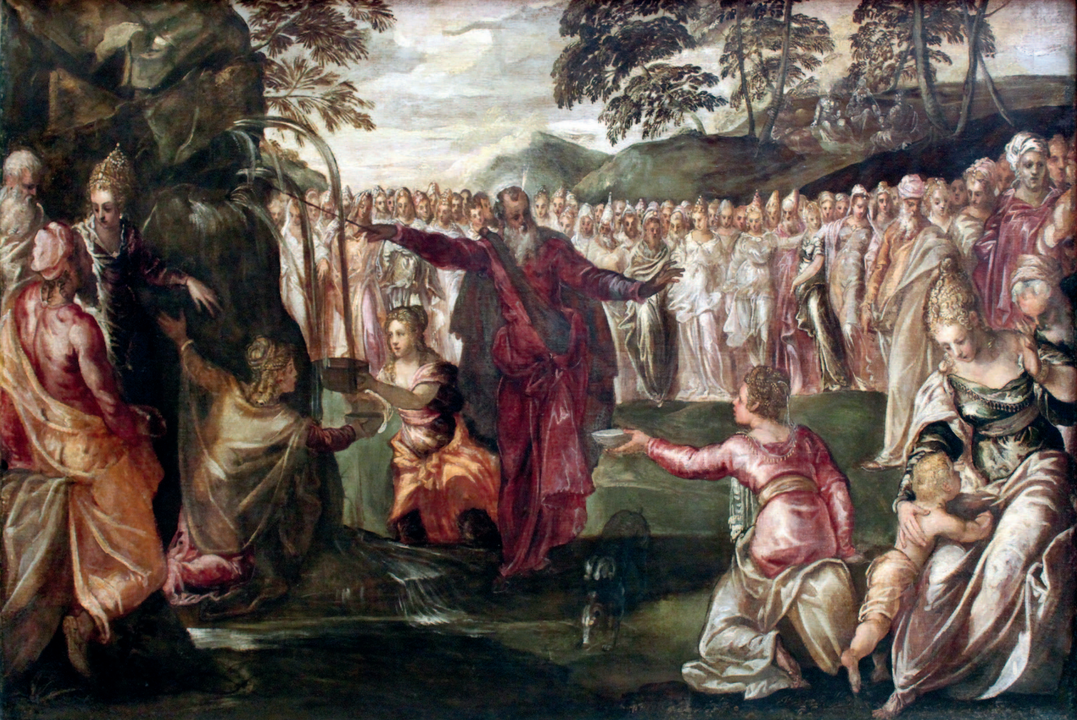
Титторетто. Моисей открывает родник в скале. 1563. Штеделевский художественный институт, Франкфурт-на-Майне