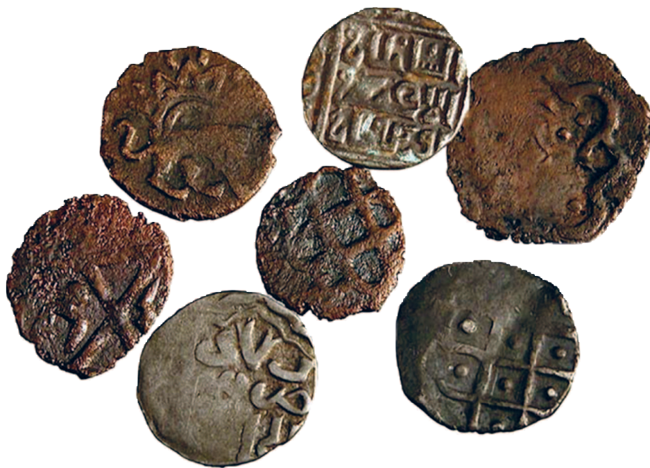
Рис. 2.1. Золотоордынские монеты

системы» 5 . То есть, захватывая новые земли, ордынцы осваивали и перерабатывали опыт денежной чеканки народов, проживавших на этой территории издавна. К тому моменту, как Поволжье оказалось в руках Золотой Орды, крупный монетный двор существовал, по-видимому, только в городе Булгар 6 . И первые монеты Чингисидов (начал их чеканить Бату, правивший в 1220–1250-е годы) были изготовлены именно там. Впоследствии монеты изготавливались также в других городах, но некоторые из них исчезли с лица земли; и о том, где именно отчеканены те или иные монеты, подчас трудно судить даже при условии, что на них есть название древнего населенного пункта (рис. 2.1).