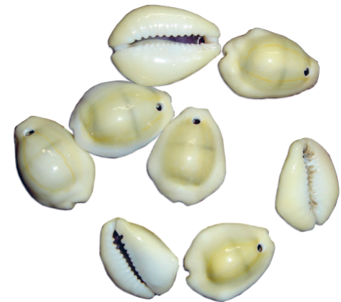
Рис. 1.7. Раковины каури

Во время раскопок на территориях бывшего Новгородского и Псковского княжеств археологами были обнаружены раковины каури, родиной которых являются острова Индийского океана. Эти раковины, формой напоминающие кофейное зерно, в древности играли роль денег в государствах Азии, Африки, были известны в Северном Причерноморье и Поволжье. Возможно, именно они в древнерусских «финансовых документах» обозначены словами «ужовки» или «змеиные головки» (рис. 1.7).