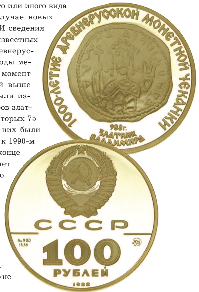
Рис. 1.5. Памятная монета 1988 года «1000-летие древнерусской монетной чеканки. Златник Владимира»