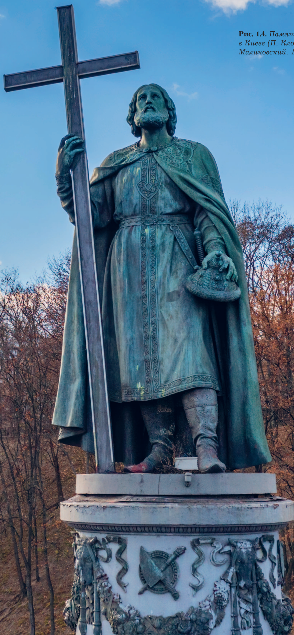
Рис. 1.4. Памятник князю Владимиру в Киеве (П. Клодт, А. Тон, А. Демут- Малиновский. 1853)