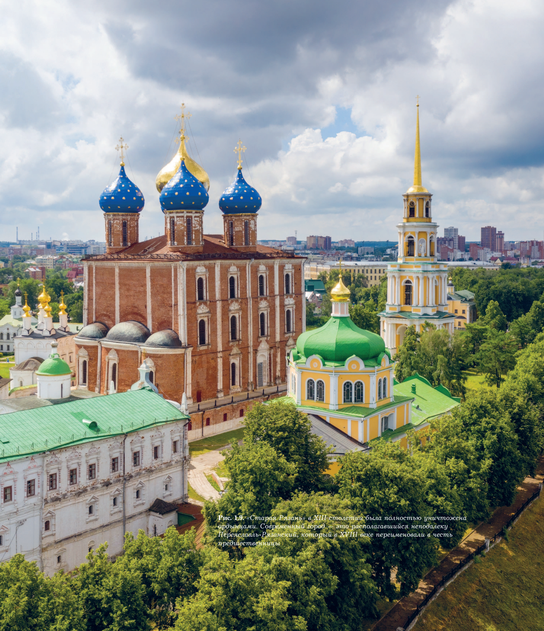
Рис. 1.9. «Старая Рязань» в XIII столетии была полностью уничтожена ордынцами. Современный город — это располагавшийся неподалеку Переяславль-Рязанский, который в XVIII веке переименовали в честь предшественницы