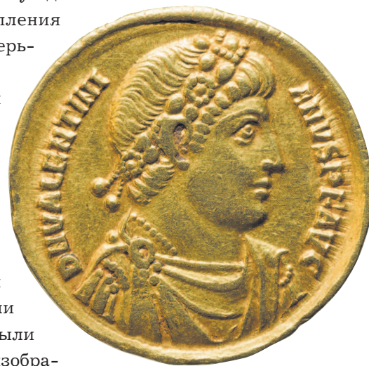
Рис. 1.2. Византийский золотой солид IV столетия с портретом императора Валентиниана II