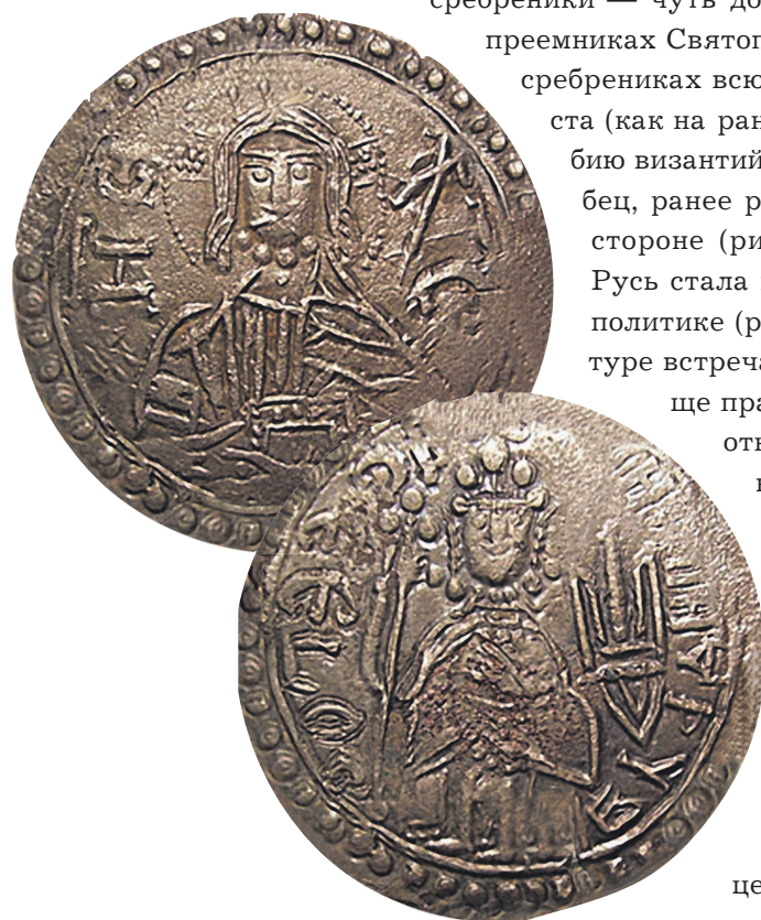
Рис. 1.3. Сребреник Владимира. Рядом с плечом князя хорошо виден княжеский знак — трезуб

Термины «сребреник» и «златник» были введены учеными. Как называли эти монеты люди, непосредственно их использовавшие, доподлинно не известно. Ситуация усугубляется еще и тем, что вплоть до конца XVIII века, когда собственно и были обнаружены первые древнерусские монеты, изучение истории денег в России по большому счету не велось.