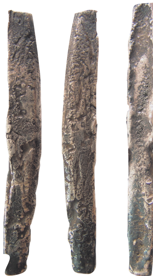
Рис. 1.8. Новгородские гривны

Исследователи выделяют и еще несколько типов гривны, но в любом случае такие слитки были удобны только для расчетов за крупные покупки. Высказывается также мнение, что они вообще использовались только во внешней торговле. Как же рассчитывались в том