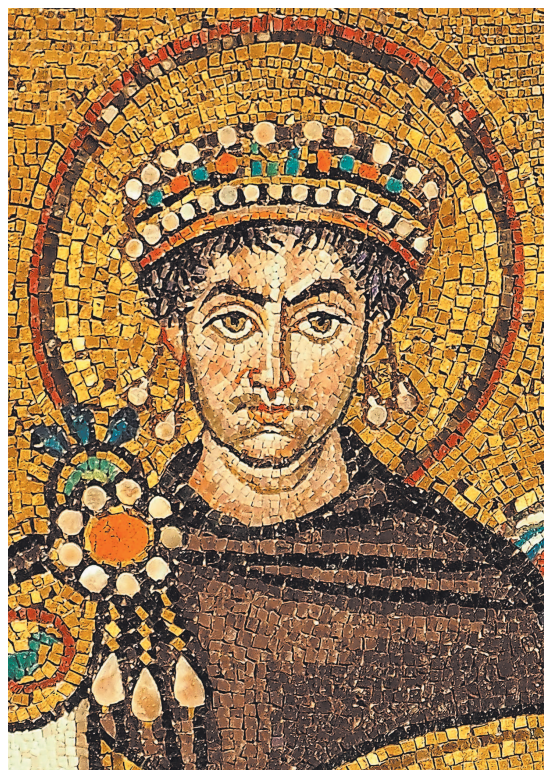
Рис. 1.1. Наивысшего расцвета Византийская империя достигла в VI столетии при императоре Юстиниане (мозаика из церкви Сан-Витале в Равенне)

большое количество иноземной монеты, как европейской, так и восточной (в первую очередь это арабские дирхемы). «До XVIII века русское денежное обращение и монетное дело зависели от привозных иностранных серебряных и золотых монет, поскольку в стране практически не было собственных месторождений драгоценных металлов, — утверждает С. В. Зверев. —