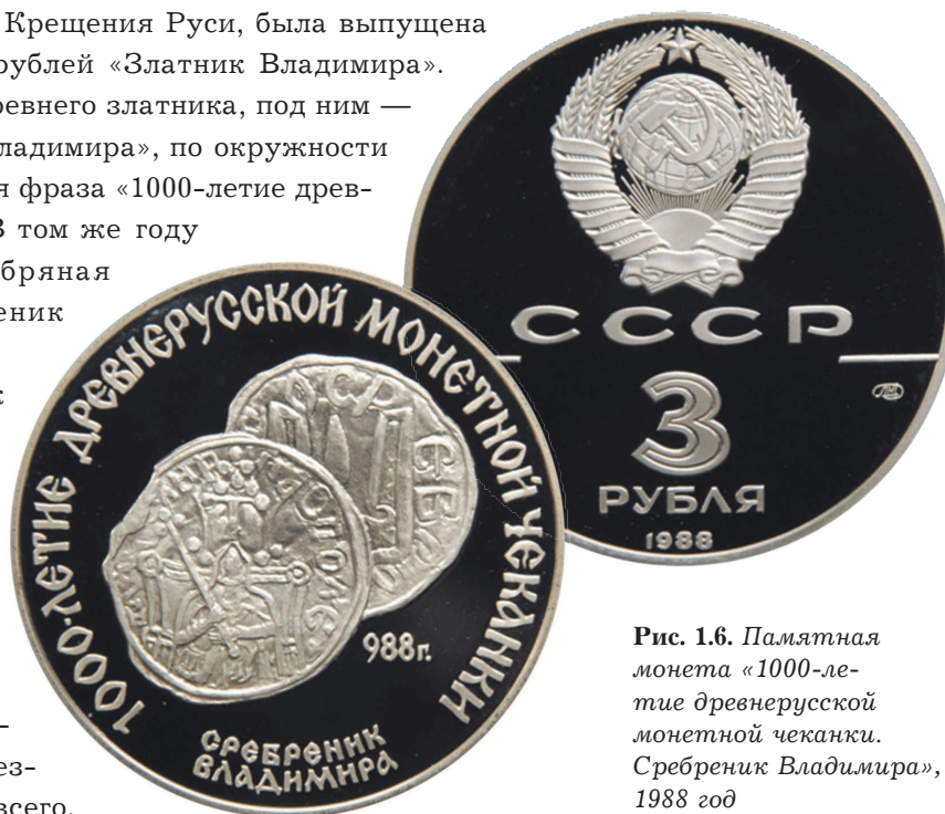
Рис. 1.6. Памятная монета «1000-летие древнерусской монетной чеканки. Сребреник Владимира», 1988 год

значимость Киева как центра государства сходилась на нет и разрозненные княжества превращались в легкую добычу для Золотой Орды. «После прекращения чеканки монет в начале XI века денежное обращение на севере Руси в течение еще около столетия питалось западноевропейскими серебряными денариями, но к началу XII века прекратилась чеканка и денариев. На Руси наступил длительный, так называемый безмонетный период денежного обращения XII — первой половины XIV века. От этого времени не дошло никаких монетных находок на территории русских княжеств, но имеется большое количество кладов серебряных слитков двух видов, двух весовых норм», — пишут исследователи 7 . То есть основой всех расчетов становится гривна — причем разных видов.