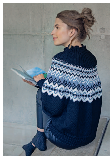
26 Зимнее настроение