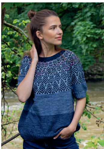
94 Синий лес