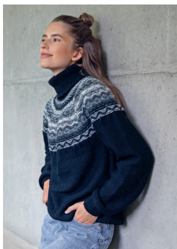
34 Все наоборот