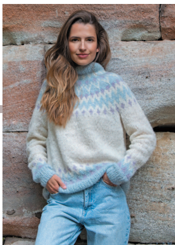
60 Зимнее небо