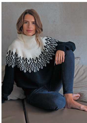
10 Ночь и день