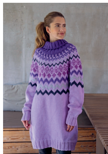
52 Зимняя сирень