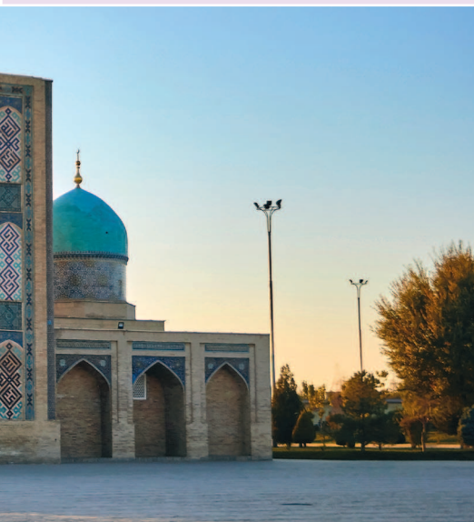
Ансамбль Хазрати Имам