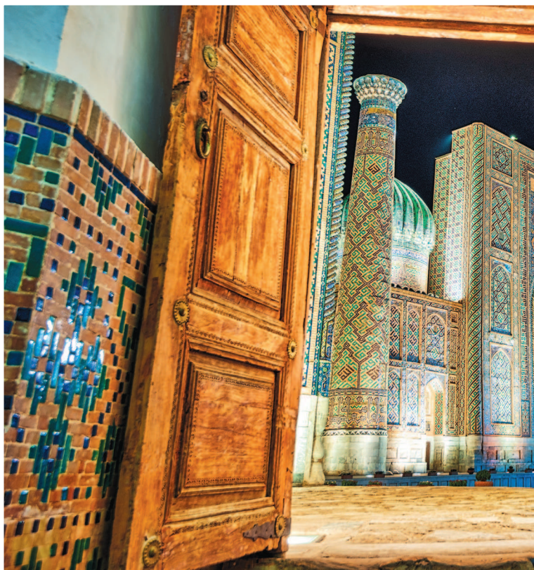
Площадь Регистан в центре Самарканды

Поддайтесь очарованию Востока — приезжайте в Узбекистан с друзьями, с семьей, в романтическое путешествие, на уик-энд или на весь отпуск. Наш путеводитель поможет вам в этом путешествии.