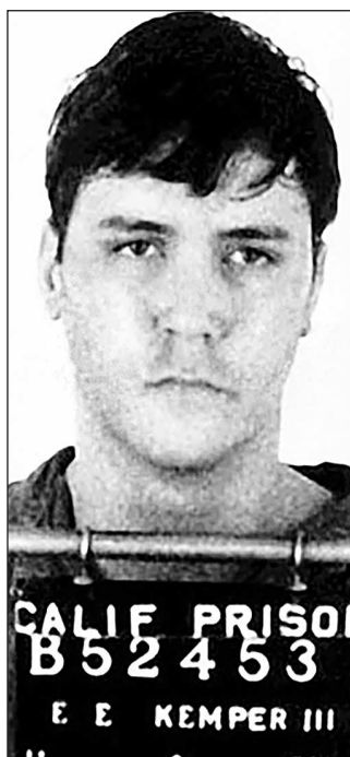
Снимок Кемпера, сделанный 9 ноября 1973 года