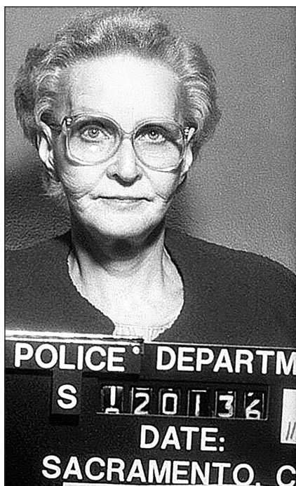
Доротея Пуэнте, «Хозяйка Дома Смерти».

Наиболее известный серийный убийца из Калифорнии, Зодиак, — идеальный пример убийцы-гедониста. Зодиак наслаждался приливом адреналина, который он получал, терроризируя улицы Сан-Франциско на протяжении 1970-х годов. Зодиак не только убивал влюбленные пары в переулках по всему городу, но и изводил прессу и полицию гнусными письмами.