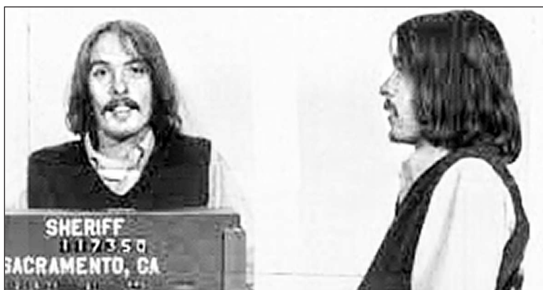
Американский серийный убийца Ричард Трентон Чейз (1950–1980).

возраст, ни раса, ни пол — только их смерть. В случае с несколькими жертвами он пил их кровь и поедал останки.