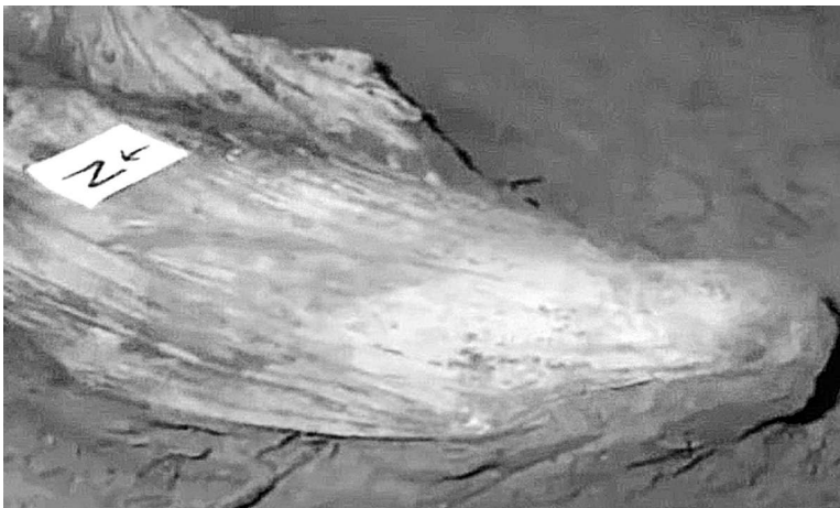
Тело, обнаруженное на территории пансионата.

Среди серийных убийц есть один печально известный преступник, который сочетает в себе элементы всех трех подкатегорий гедонистических убийств. Гарольд Шипман, британский врач общей практики, считается одним из самых кровожадных серийных убийц в современной истории, на счету которого около 250 жертв. Шипман получал удовольствие от убийств как на сексуальной почве, так и на почве острых ощущений, а в одном случае подделал завещание одной из жертв, включив в него себя.