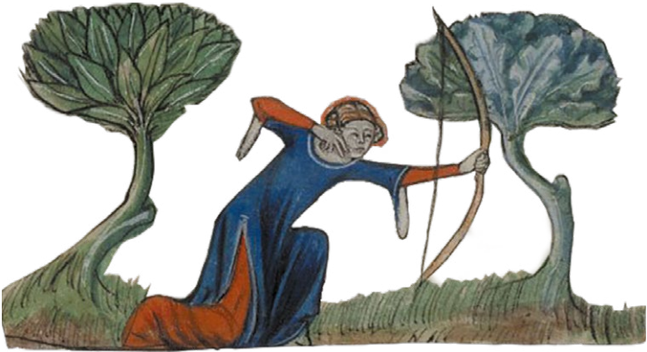
Знатная дама за неожиданным занятием