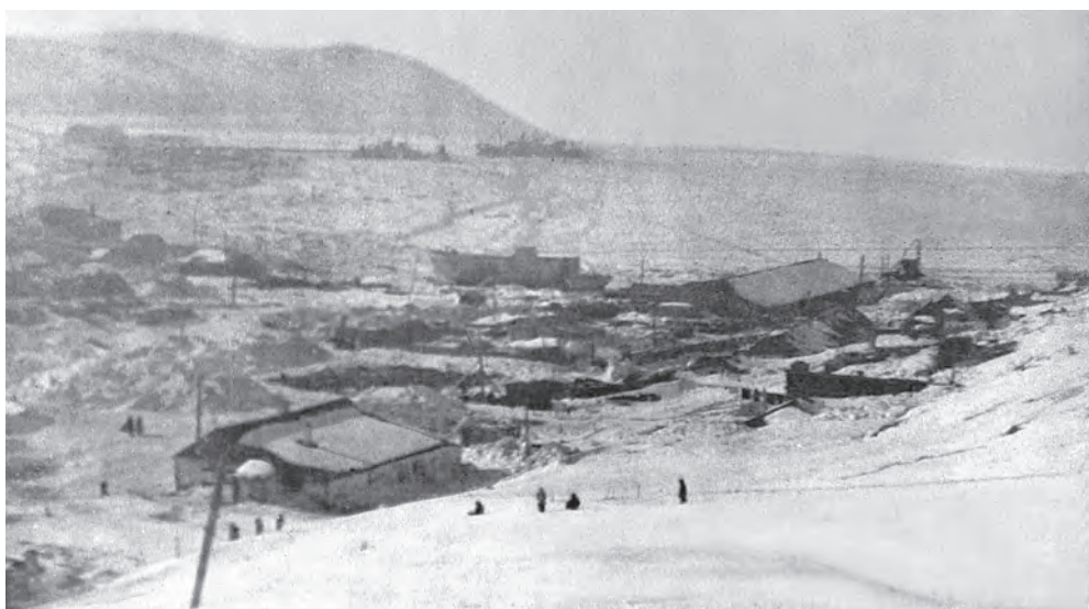
Бараки в поселке Марчекан, где жила Евгения Гинзбург. 1950 (?) ↓