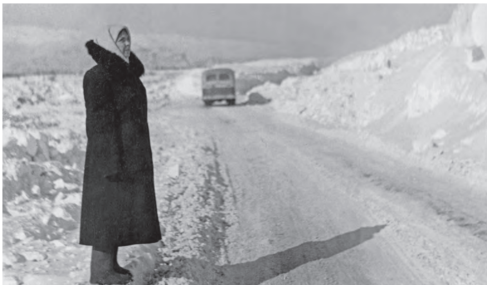
↑ Дорога в поселок Марчекан, около 5 километров от Магадана. 1950 (?)