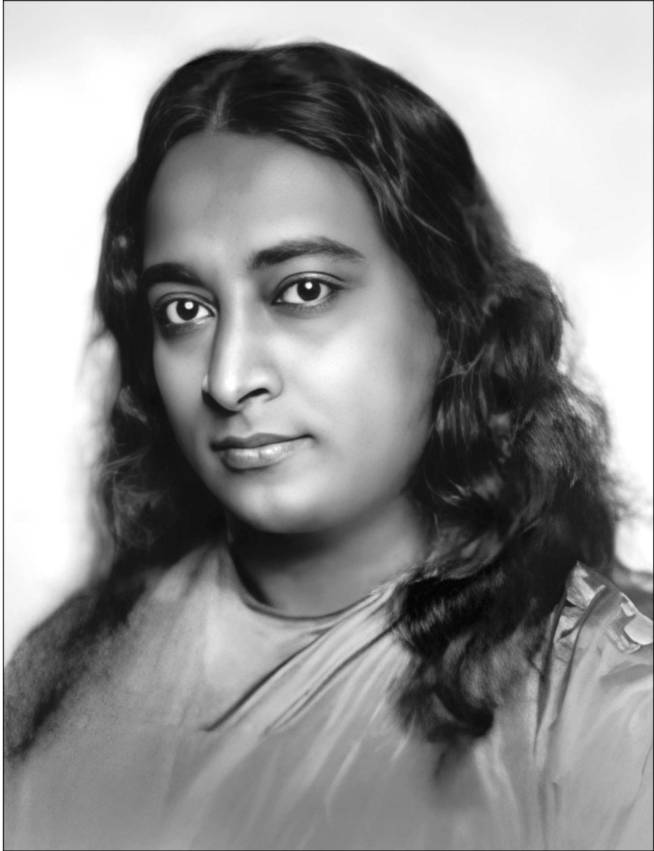
Рис. 1. Парамаханса Йогананда