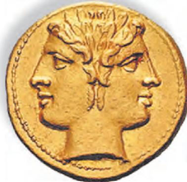
Золотая древнегреческая монета с изображением двуликого Януса