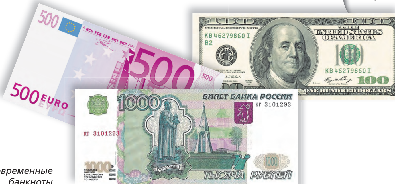
Современные банкноты России, США, Евросоюза

Однако возить с собой крупные суммы в золотых и серебряных монетах было тяжело и опасно – на дорогах хозяйничали разбойники, а на морях – пираты. И потому в конце концов люди отказались от золотых и серебряных монет и стали использовать в качестве денег специальные