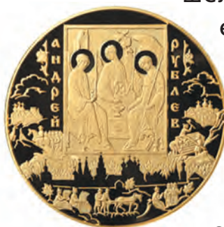
Золотая монета России достоинством 10 000 рублей