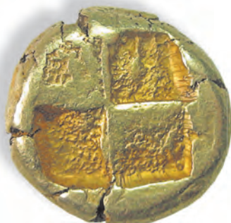
Золотая монета Древнего Вавилона