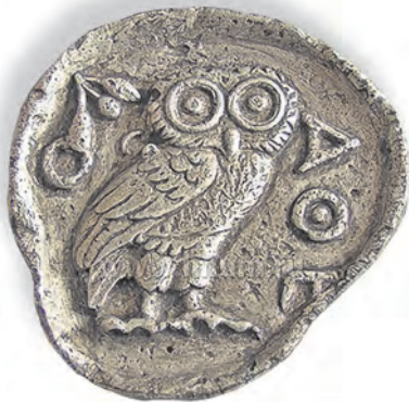
Античная монета (Древние Афины)

Он довольно улыбнулся и горделиво посмотрел на отца, явно рассчитывая на похвалу за быстрый ответ. Но оказалось, что это лишь малая часть того, что называется деньгами и ради чего деньги нужны людям. И дальше папа рассказал Серёже вот что.