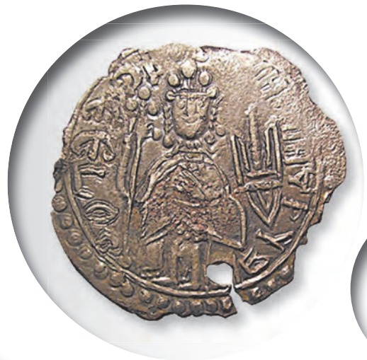
Сребреник князя Владимира Красное Солнышко