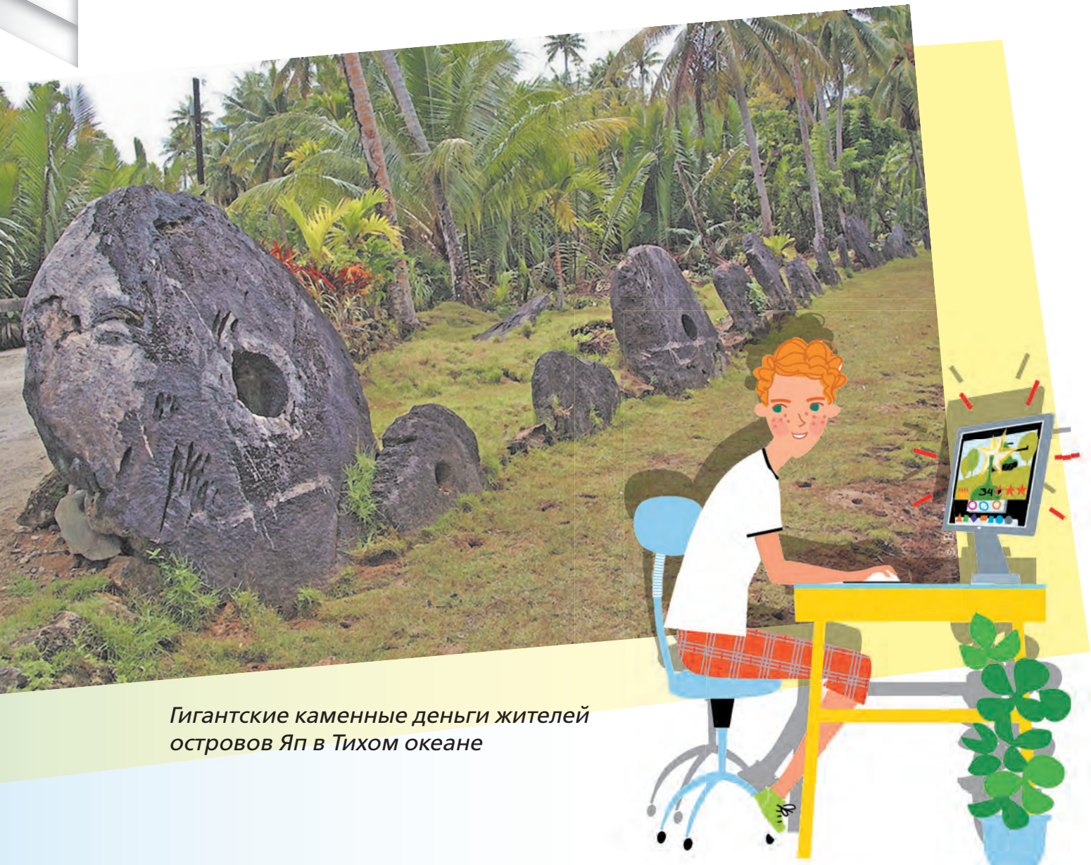
Гигантские каменные деньги жителей островов Яп в Тихом океане

Пришлось Серёже после ужина остаться на кухне для беседы о деньгах. Разговор папа начал с вопроса: а что это