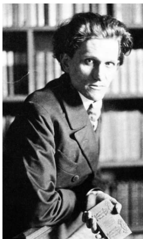
Стефан Георге в молодости

воплотил в 15-летнем юнце по имени Кронфельд, не что другое, как Яхве!»