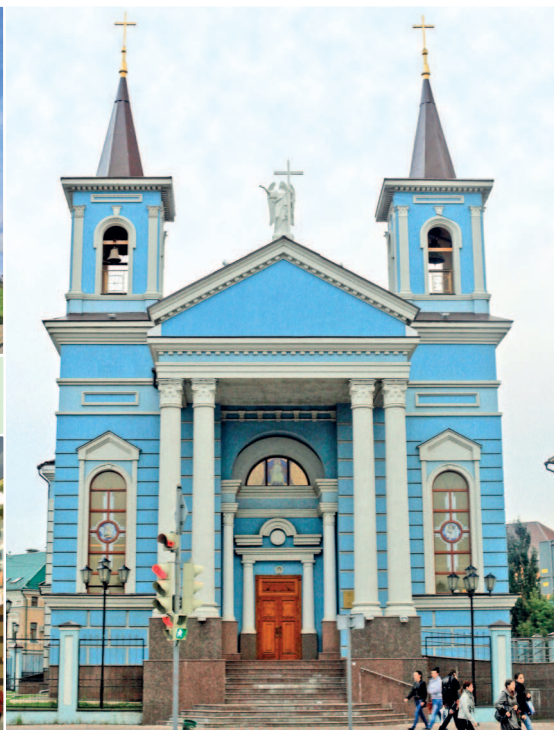
Католический храм Воздвижения Святого Креста