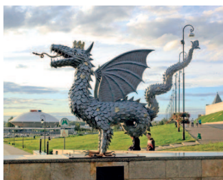
Крылатый змей Зилант — символ Казани