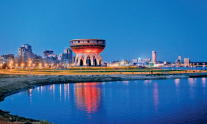
Панорама новых районов Казани