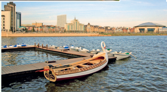
Прогулочные лодки ждут туристов на набережной озера Кабан