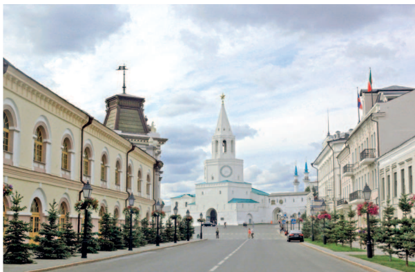
Вид на Спасскую башню со стороны Кремлевской улицы

День второй. Этот день рекомендуем начать с прогулки по Старо-Татарской слободе (▷ 40). Познакомьтесь со старинными домами и усадь-