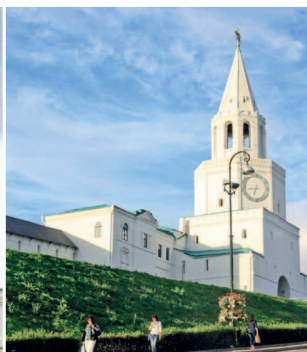
Спасская башня — главные ворота Кремля

Улица Баумана заполнена людьми в любое время суток