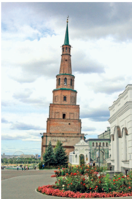
Падающая башня Сююмбике

Улица Баумана заполнена людьми в любое время суток