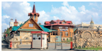
Татарская деревенька «Туган авылым» в центре города