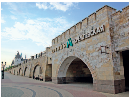
Станция метро «Кремлевская»

Точных данных о том, когда на этом месте появилось первое укрепленное поселение, нет — одни ученые считают, что это произошло еще в X веке, другие называют XII век, однако изначально крепость болгарских князей была деревянной. После 1445 года, когда образовалось Казанское ханство, крепость была укреплена, ее