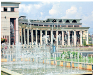
Площадь фонтанов перед театром Камала

Если вы держите в руках этот путеводитель, то, скорее всего, вы еще не были в третьей столице России. Но, вероятно, вы планируете визит в этот тысячелетний и одновременно такой молодой город. Мы постарались передать на его страницах всю красоту и энергетику города, пропитанного историей, легендами, молодостью и событиями мирового масштаба.