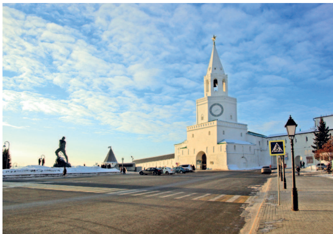
Знакомство с Кремлем начинается со Спасской башни

околожили мощными дубово-каменными стенами толщиной до 9 метров и глубокими рвами. С четырех сторон над стенами возвышались проездные башни: Елабуга, Нур-Али, Большие и Тюменские ворота. В таком виде цитадель простояла больше века, пока в 1552 году после долгой осады она не была взята войсками Ивана Грозного. Руинированную крепость перестроили, заменив все деревянные оборонительные сооружения на каменные.