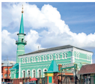
Одна из красивейших мечетей Казани — Султановская, основанная в 1868 году