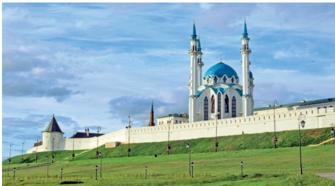
Казанский кремль — объект Всемирного наследия ЮНЕСКО