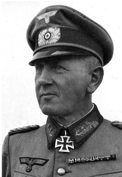
Командир немецкой 352-й пехотной дивизии генерал-майор Дитрих Крайсс.

91-я мобильная (первоначально планерно-десантная) дивизия генерал-лейтенанта Вильгельм Фаллея была сформирована в январе 1944 года в рамках подготовки к операции по захвату острова Гогланд, но в марте планы изменились, и дивизию перебросили в Нормандию для усиления двух стационарных подразделений на полуострове Котантен. Формирование дивизии так и не было закончено, и она располагала только двумя пехотными полками и одним фузилерским батальоном, при общей численности солдат и офицеров примерно 7500 человек. 91-й дивизии был придан 6-й па-