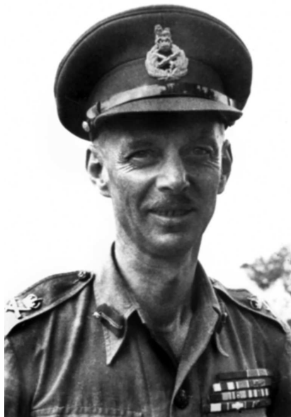
Командующий 2-й британской армии генерал-лейтенант сэра Майлс «Бимбо» Дэмпси.

Вступив в должность командующего 21-й группы армий, Монтгомери постарался привлечь к вторжению как можно больше подразделений с боевым опытом, а в тех частях, которым не довелось познакомиться с порохом, произвел кадровые перестановки, внедрив в командование офицеров, воевавших с ним в Африке и Средиземноморье. Изготовившейся к прыжку через Ла-Манш 2-й британской армией командовал генерал-лейтенант сэра Майлс «Бимбо» Дэмпси – давний друг и коллега Монтгомери. Армия включала в себя два корпуса: 1-й генерал-лейтенанта Джона Крокера и 30-й генерал-лейтенанта Джерарда Бакнелла. В 1-й корпус Крокера входили: британская 3-я пехотная дивизия генерал-майора Томаса Ренни; канадская 3-я пехотная дивизия генерал-майора Рода Кел-