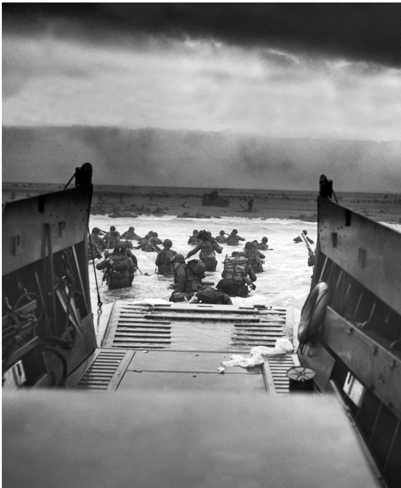
Высадка американской штурмовой пехоты роты «Е» 16-й ПБГ 1-й пехотной дивизии с десантных катеров на участке «Омаха» под плотным пулеметным огнем немцев.