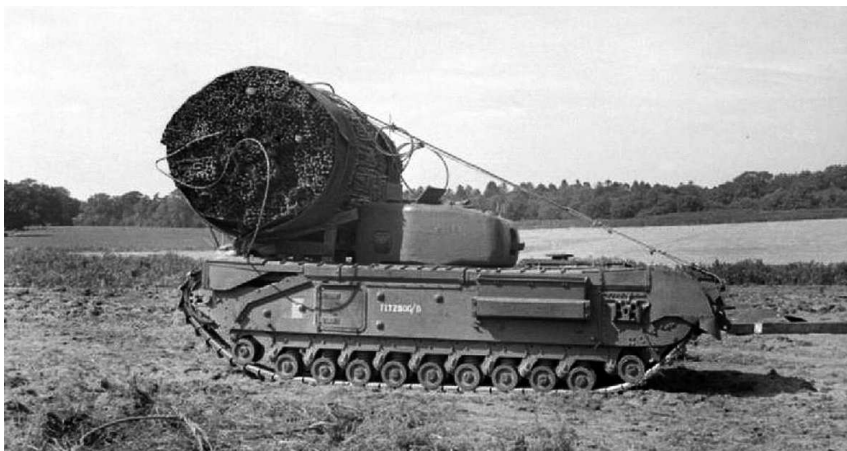
«Игрушки Хоббарта». Танк AVRE с фашиной для заполнения воронок и противотанковых рвов.

Финальный план операции «Оверлорд» выглядел следующим образом: весь фронт вторжения был разделен на два сектора ответственности – западный американский и восточный британский. Это разделение определялось географией размещения войск на Британских островах. В западном секторе 1-я армия США генерала Омара Брэдли силами трех пехотных дивизий будет высаживаться на участках «Юта» и «Омаха». Дополнительно две американские воздушно-десантные дивизии – 82-я и 101-я, прикроют западный фланг плац-