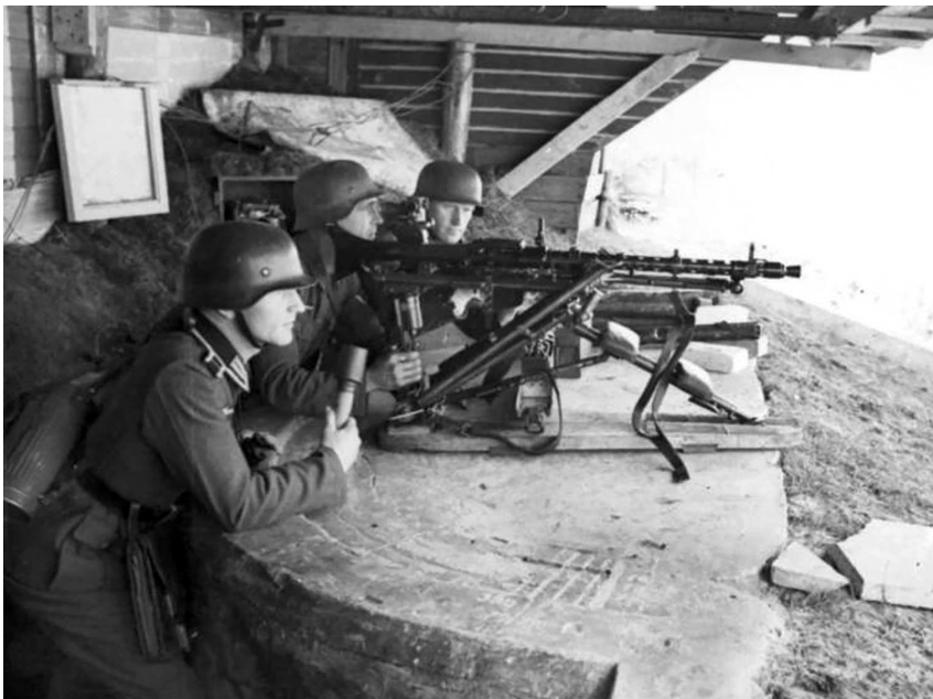
Пулеметный расчет на бетонной позиции во время регулярных тренировок по отражению высадки союзников.

Участок «Юта» входил в зону ответственности 709-й пд генерал-лейтенанта Карла Вильгельма фон Шлибена. Она была сформирована в мае 1941 года как оккупационная, но в ноябре 1942 года переквалифицирована в стационарную. В июне 1944 года три ее пехотных батальона были доукомплектованы восточными добровольцами. Всего по состоянию на конец мая 1944 года в 11 (вместо стандартных 9) батальонах дивизии было 12320 солдат и офицеров, из которых 2117 относились к Osttruppen (333 из них были грузинами). Три артиллерийских батальона дивизии были оснащены орудиями, захваченными во время Французской и Польской кампаний и на раннем этапе войны с СССР, а также реквизированными из чешской армии. Для борьбы с танками дивизия имела 12 буксируемых 75-мм ПТО и девять самоходных 75-мм истребителей танков. 101-й танковый батальон был учебным подразделением и все