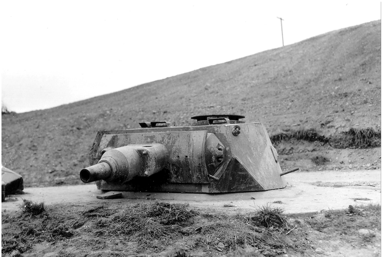
Бетонный бункер с башней танка Pz.Kpfw. IV на участке высадки «Омаха».

шестью танками Pz.Kpfw.III; 23 трофейными французскими танками Somua; 43 САУ на шасси французского танка Hotchkiss; 45 транспортера и САУ на шасси французского тягача Lorraine. Что касается личного состава, то он представлял собой такую же мешанину из сумевших избежать пленения в Тунисе солдат Африканского корпуса, циничных ветеранов Восточного фронта и военнослужащих, отбракovaných из различных подразделений 7-й армии. Фон Швеппенбург называл 21-ю дивизию дефективной, а ее танкистов «идиотами, неспособными освоить даже базовый курс подготовки». Генерал-майор Фёхтингер не имел опыта командования танковыми частями. 21-ю тд ему доверили, главным образом, благодаря связям