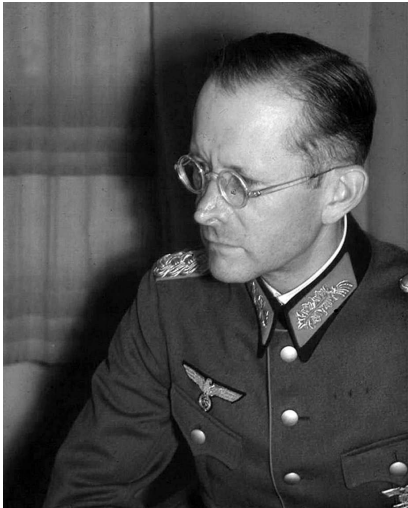
Командир 84-й армейского корпуса генерал Эрих Маркс.

чески выступал ветеран танковых битв на Восточном фронте генерал Лео Гайр фон Швеппенбург, поддерживаемый командующим Западной группы войск фельдмаршалом фон Рундштедтом. Швеппенбург считал, что танковые резервы следует держать вдали от береговой линии и не вводить в бой, пока не станут ясны намерения противника. Лишь после этого хорошо сконцентрированной и продуманной контратакой силы вторжения должны быть разбиты и сброшены в море. Обе концепции имели свои «за» и «против», и будь любая из них исполнена в полной мере (при обеспечении возможности командирам на местах распоряжаться танковыми подкреплениями по собственному усмотрению в интересах текущего момента), войска вторжения оказались бы в весьма сложном положении, а вся кампания в Нормандии могла пойти совершенно иным путем. Но Гитлер, к которому Роммель и Швеппенбург обратились за поддержкой, выбрал наименее худшее решение – компромиссное. Севернее реки Луара Роммель получил под командование три танковые дивизии – 2-ю, 21-ю и 116-ю. Остальные пять распределялись между штабами Рундштедта и танковой группы «Запад». Однако ни одна из этих дивизий не была