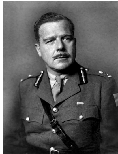
Командир канадской 3-й пехотной дивизии генерал-майор Род Келлер.

Участок «Джуно» простирался почти на 10 км от предместий Ла Ривьер на западе до Сен-Обен-сюр-Мер на востоке. При планировании операции этот отрезок побережья