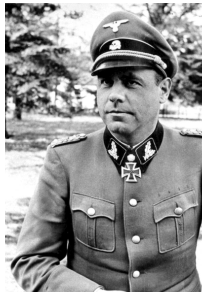
Командир 12-й танковой дивизии СС «Гитлерюгенд» группенфюрер Фриц Витт.

Бетонные укрепления вдоль береговой линии и в близком тылу формировали два вида оборонительных позиций WN (widerstandnest, «неподвижная укрепленная позиция») и StP (stutzpunkt, «опорный пункт»). Союзники называли опорными пунктами и те, и другие. Типовой опорный пункт был рассчитан на гарнизон примерно 50 человек (в укрепленных позициях он мог достигать 200 человек и даже