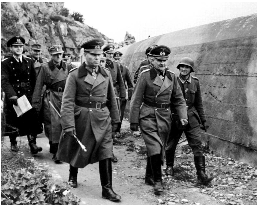
Генерал-фельдмаршал Эрвин Роммель во время инспекции береговой линии Нормандии.

Поэтому Роммель понимал, что полагаться придется только на свои силы, и считал необходимым держать резервы как можно ближе к переднему краю. Но против намерений Роммеля категори-