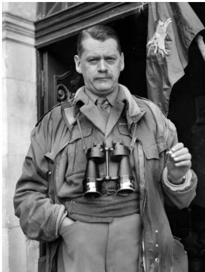
Командир 6-й британской воздушно-десантной дивизии генерал-майор Ричард Гэйл.

Второй штурмовой дивизией 1-го британского корпуса была канадская 3-я пд генерал-майора Рода Келлера. Выбор канадской дивизии в качестве подразделения первой волны десанта был вполне предсказуем. Канадские войска к этому времени составляли зна-