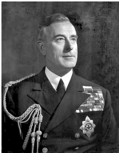
Лорд Луис Маунтбеттен, под началом которого были разработаны основные принципы будущего вторжения союзников на Европейский континент.

Осенью 1940 года, едва лишь миновала угроза немецкой высадки на Британские острова, Черчилль в радиообращении заверил население оккупированной Франции, что ждать освобождения осталось недолго – экспедиционный корпус союзников обязательно вернется на Континент и изгонит нацистов. Несмотря на громкие обещания, ни сам премьер, ни его генералитет не горели особым желанием высаживаться во Франции. Силы были слишком неравны. Определенные шаги, тем не менее, предпринимались. В октябре 1941 года назначенный на должность главы Командования комбинированных операций лорд Луис Маунтбеттен получил от Черчилля такое наставление: «Я хочу, чтобы вы приступили к подготовке нашего великого вторжения в Европу. Вы долж-