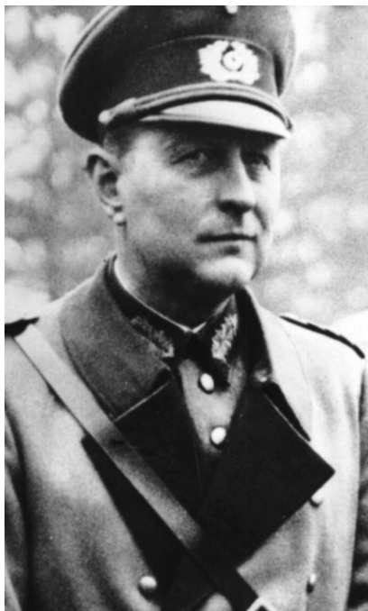
Командующий танковой группы «Запад» генерал Лео Гайр фон Швеппенбург.

ным условием для Германии избежать полного разгрома на Востоке. «Сбросив в море силы вторжения, мы отобьем у врага желание пытаться еще раз», – указывал Гитлер в Директиве. «Поражение нанесет серьезный удар по моральному духу англичан и американцев». После того, как ситуация на Западном фронте будет должным образом разрешена, 45 дивизий, расположенных в Европе, можно будет перебросить на Восточный фронт, чтобы нанести сокрушительное поражение Красной армии. «Вот поэтому весь исход войны и судьба самого Рейха зависят сейчас от каждого бойца, сражающегося на Западе».