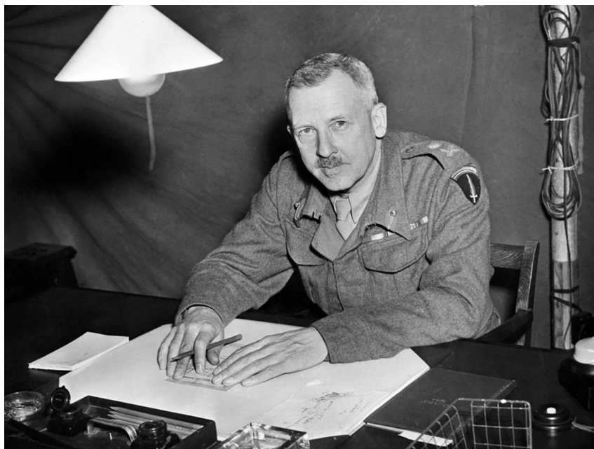
Глава COSSAC генерал-лейтенант Фредерик Морган.