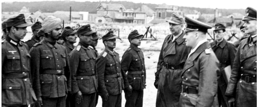
Генерал-фельдмаршал Эрвин Роммель знакомится с личным составом одного из опорных пунктов нормандского побережья. Несмотря на сомнительную боевую ценность, «восточные добровольцы» активно использовались немцами в стационарных дивизиях на Западном фронте.

и «стоять до конца каждый на своем месте», как призывал Гитлер. Не редкостью были подразделения со специальным меню, поскольку в них набирали солдат с болезнями органов пищеварения. Встречались роты тугоухих и батальоны хромых. Немалую долю защитников Атлантического вала составляли так называемые «добровольцы с Востока», подразделения которых поступали на замену более боеспособным частям, перебрасываемым на Восточный фронт. Их комплектовали из рекрутов с оккупированных территорий Восточной Европы и СССР, и бывших военнопленных Красной армии, которые записывались в Вермахт как по идейным соображениям, так и просто для того, чтобы избежать мучительной голодной смерти в лагерях. Из всех переметнувшихся на сторону Германии добровольцев славяне считались наименее надежными. Их старались использовать главным образом в качестве хиви (добровольных помощников) в службах обеспечения. Грузины, армяне, азиатские народности воспринимались как более благонадежные и набранные из них подразделения интегрировали в немецкие батальоны и полки. Ко дню «Д» примерно 75000 восточных добровольцев служили в немецкой армии во Франции, каждый шестой пехотинец в армиях фон Рундштедта был выходцем с Востока.