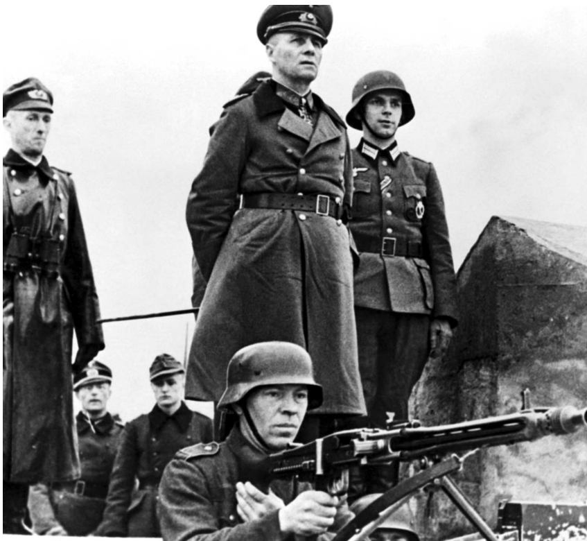
Роммель наблюдает за учебными стрельбами одного из гарнизонов, защищавших побережье Нормандии