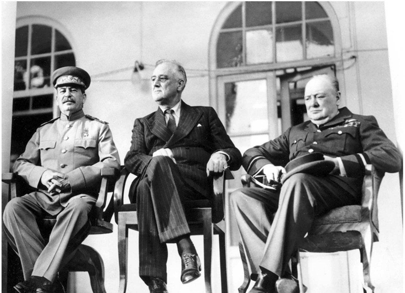
Конференция «Большой Тройки» в Тегеране в 1943 году стала переломным моментом в судьбе операции «Оверлорд».

командование, 9-е тактическое командование и 10-я группа аэрофоторазведки. Начав свои операции за несколько месяцев до назначенного дня «Д», тактические ВВС имели задачей последовательное уничтожение широкой дорожной инфраструктуры, чтобы максимально сократить (а в идеале – свести к нулю) переброску резервов и грузов в Нормандию. Отдельное внимание уделялось аэродромам, расположенным в радиусе 200 км от побережья и ключевым мостам через Сену и Луару, уничтожение которых позволило бы эффективно изолировать примыкающие к пляжам высадки районы от остальной части Франции. С началом вторжения спектр задач тактических ВВС предполагалось еще более рас-