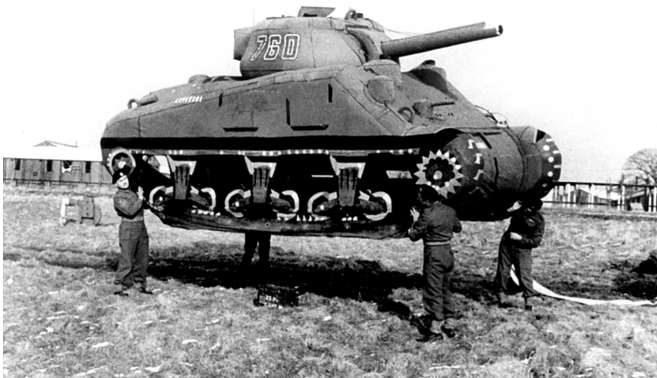
Надувной макет американского танка М4 «Шерман» на юге Англии. Подобные муляжи военной техники использовались в рамках операции «Фортитюд» для имитации развертывания ложных армий союзников в Эдинбурге и на юге Англии, целью которой было отвлечение внимания немцев от Нормандии.