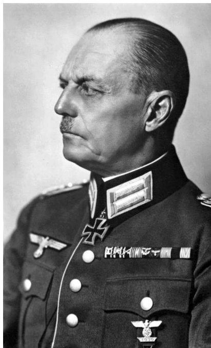
Главнокомандующий группы армий «Запад» генерал-фельдмаршал Герд фон Рундштедт.

фронте, то последствия этого – в самых ошеломляющих пропорциях – скажутся в самое ближайшее время. В связи с этим я больше не могу мириться с дальнейшим ослаблением Западного фронта в пользу других театров военных действий. Я решил усилить защиту на Западе, особенно в тех местах, откуда мы начнем свои дальнейшие операции против Англии 1 .