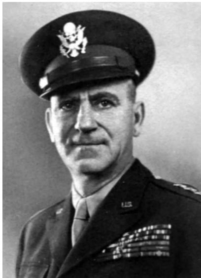
Командир американского 5-го корпуса генерал-майор Леонард Героу.

планировании операции его разделили на три сектора – «Итэм» ( Item ), «Джиг» ( Jig ) и «Кинг» ( King ). Сектора «Джиг» и «Кинг» в свою очередь дробились на подсекторы «Грин» (западный) и «Ред» (восточный). Большая часть участка «Голд» считалась непригодной для высадки, поскольку между Портан-Бессен и Арроманшем над береговой линией доминировали высокие меловые утесы. Для высадки можно было использовать лишь береговую линию между Ле Амель и Ла Ривьер. 50-ю пехотную дивизию решили высаживать фронтом в две бригады. Штурмовые 69-я и 231-я бригады будут доставлены в сектора «Кинг» и «Джиг» соответственно, вторым эшелоном за ними последуют 151-я и 56-я бригады. В секторе «Кинг» 69-я бригада атакует берег двумя батальонами: 6-й батальон гринговардского полка высадится в подсекторе «Кинг Грин», а 5-й батальон восточно-йоркширского полка – в подсекторе «Кинг Ред». Аналогично были расставлены силы и в секторе «Джиг». Задачи штурмовых частей в обоих секторах высадки были сходными: нейтрализация противника на пляжах и прилегающей территории;