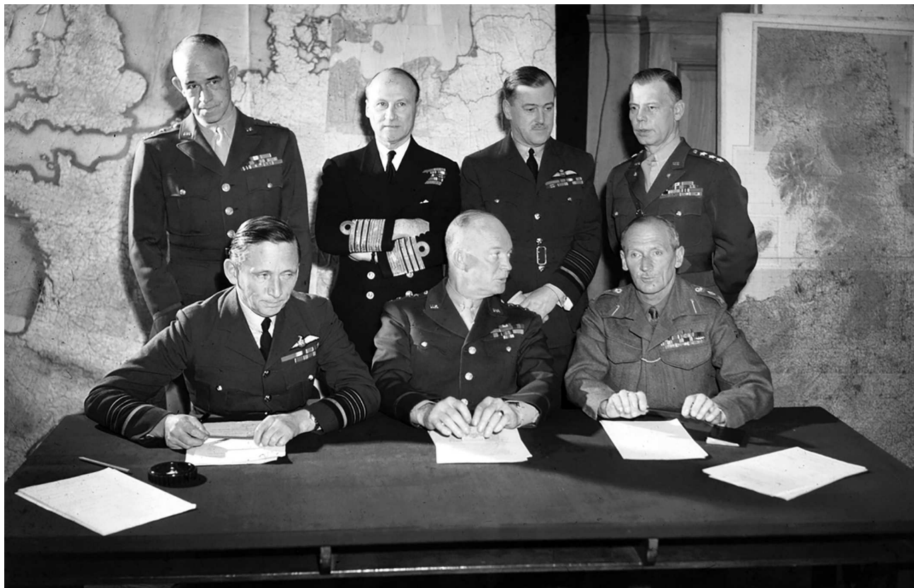
Старшие офицеры союзников, вовлеченные в операцию «Оверлорд». Слева направо верхний ряд: генерал-лейтенант Омар Брэдли (1-я американская армия), адмирал сэра Бертрам Рамсей (командующий военно-морских сил вторжения), старший маршал авиации сэра Трэффорда Ли-Мэллори (командующий военно-воздушных сил вторжения), генерал-лейтенант Бедэл Смит (начальник штаба SHAEF). Слева направо нижний ряд: старший маршал авиации сэра Артура Тэддера (заместитель Верховного командующего экспедиционных сил), генерал Дуайт Эйзенхауэр (Верховный командующий), генерал-Бернард Лоу Монтгомери (командующий 21-й группы армий).

ные работы. Однако Сопротивление докладывало, что реальные результаты налетов не соответствуют ожиданиям. Железнодорожная сеть страны настолько густая, что позволяет достаточно легко развозить составы в объезд поврежденных участков и станций. За первые шесть недель бомбардировок общий объем железнодорожных перевозок сократился не более чем на 10%. Ситуация изменилась кардинально, когда к налетам на дороги и сортировочные станции были добавлены систематические атаки мостов и туннелей. К моменту вторжения 74 моста и туннеля, ведущих к побережью Нормандии, были уничтожены или выведены из строя. По меткому выражению Черчилля северо-западная Франция