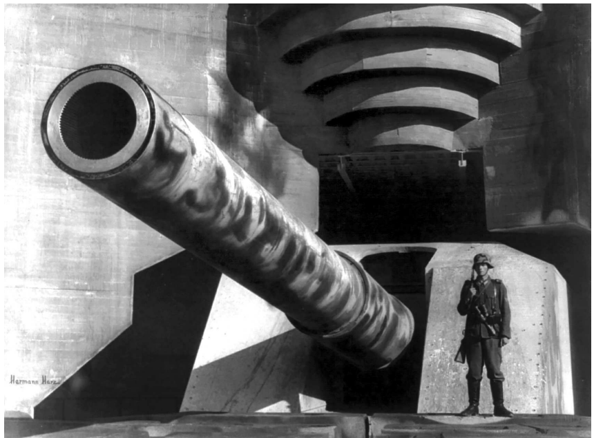
Один из пропагандистских снимков, призванных возвеличить мощь Атлантического вала.