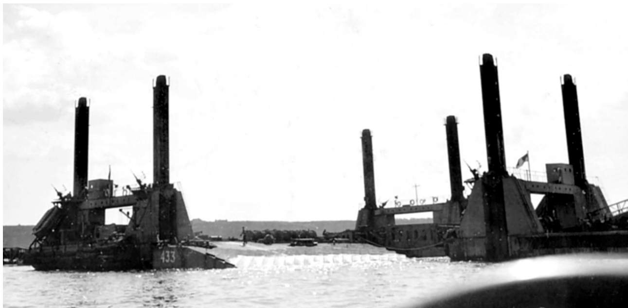
Высший секрет союзников – искусственная гавань «Малберри», позволившая выгрузить на побережье Нормандии военную технику, личный состав и грузы снабжения в рамках наращивания сил на береговом плацдарме.