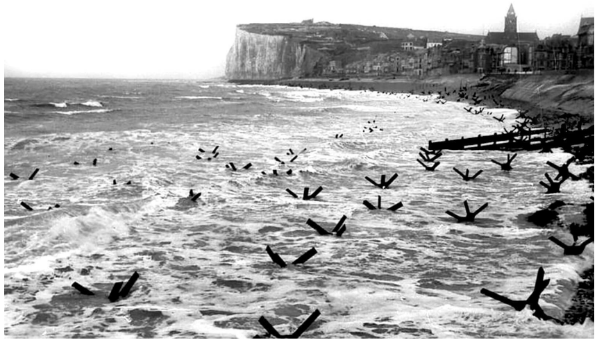
Береговая линия в районе Па-де-Кале.

но еще большая опасность грядет с Запада. Эта опасность – англо-американское морское вторжение. На Востоке потеря даже значительной части захваченного нами обширного пространства не нанесет смертельного удара по жизнеспособности Германии. Иное дело – Запад. Если противник сумеет прорвать нашу оборону на широком