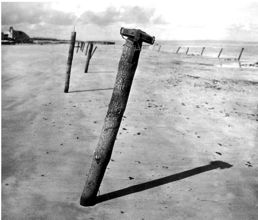
Типовое немецкое береговое препятствие – деревянная надолба с установленной на вершине миной. Сотни тысяч подобных преград были оборудованы вдоль побережья Нормандии по приказу Роммеля в течение нескольких месяцев, предшествовавших вторжению союзников.