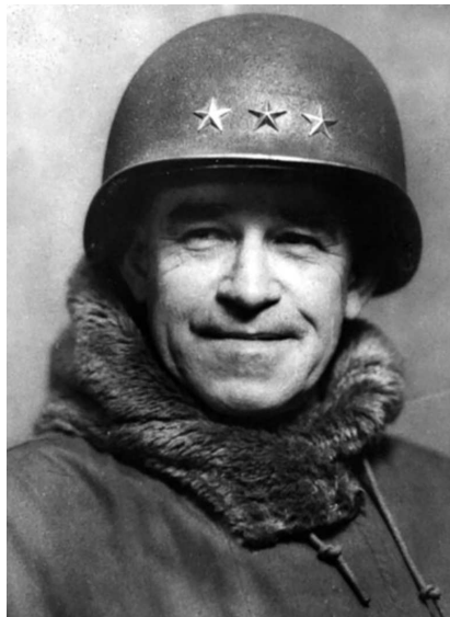
Командующий американской 1-й армии генерал-лейтенант Омар Брэдли.

са, 2-й глостерширский и 2-й эссекский батальоны) 1 и 231-ю бригаду (1-й гемпширский, 1-й дорсетширский и 2-й девонширский батальоны). Последняя имела за плечами две высадки с моря и считалась самым опытным десантно-штурмовым подразделением британской армии. Ее включение в состав дивизии также было инициативой Монтгомери. Танковую поддержку пехотным частям дивизии в ходе вторжения поручили осуществлять 8-й бронетанковой бригаде, включавшей 4-й/7-й полк гвардейских драгун, 24-й уланский полк и полк шервудских рейнджеров. Временно под командование штаба 50-й дивизии передали также 47-й батальон Королевских морских коммандос из 4-й бригады специального назначения.