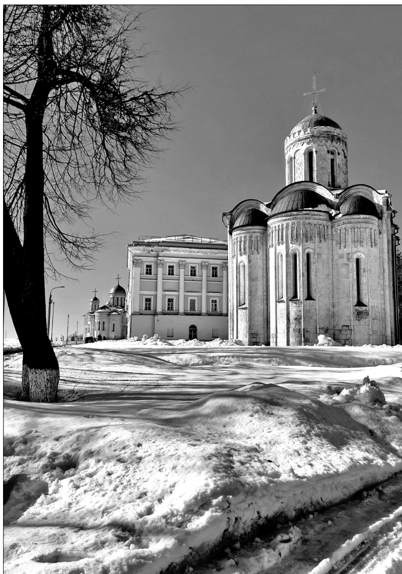
Дмитриевский собор зимой