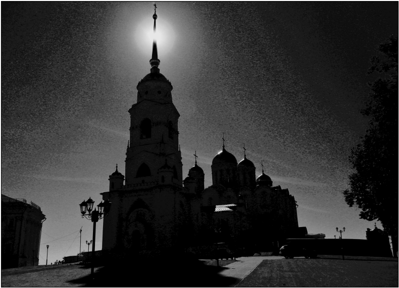
Успенский собор в ночи