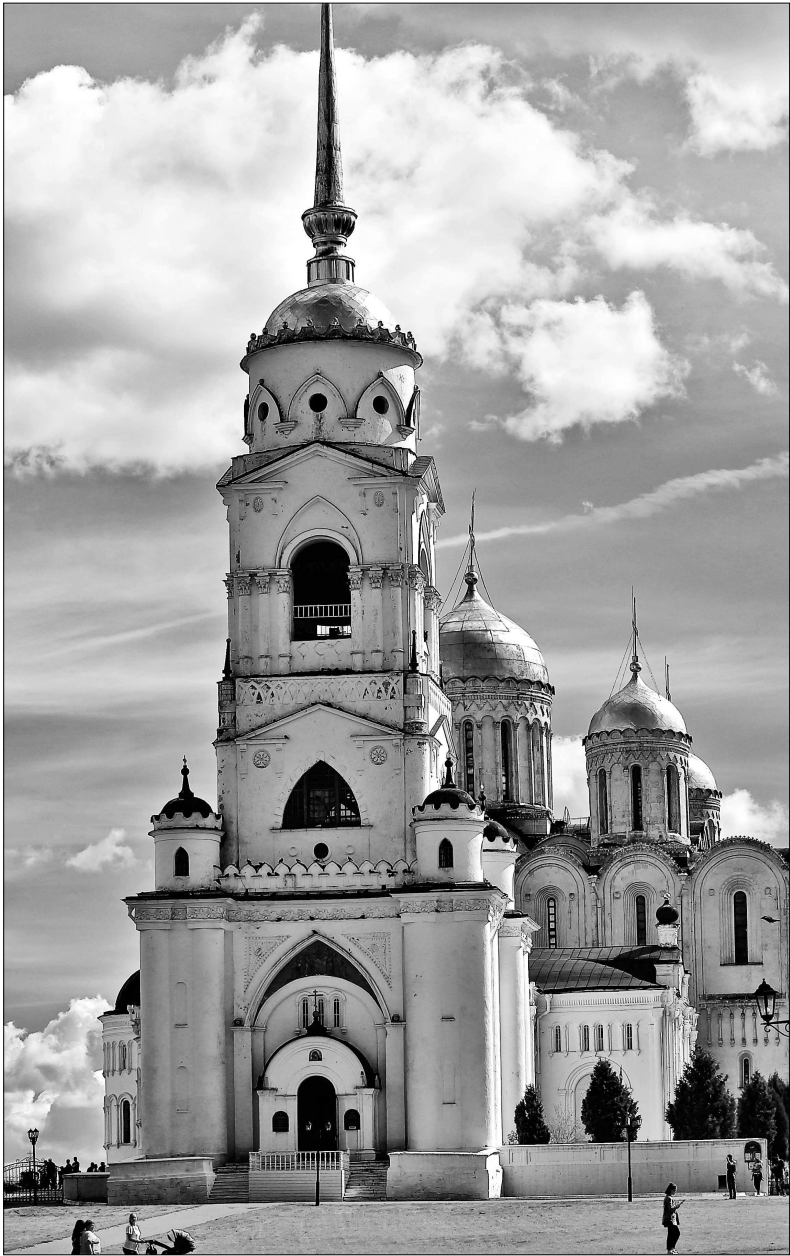
Колокольня Успенского собора