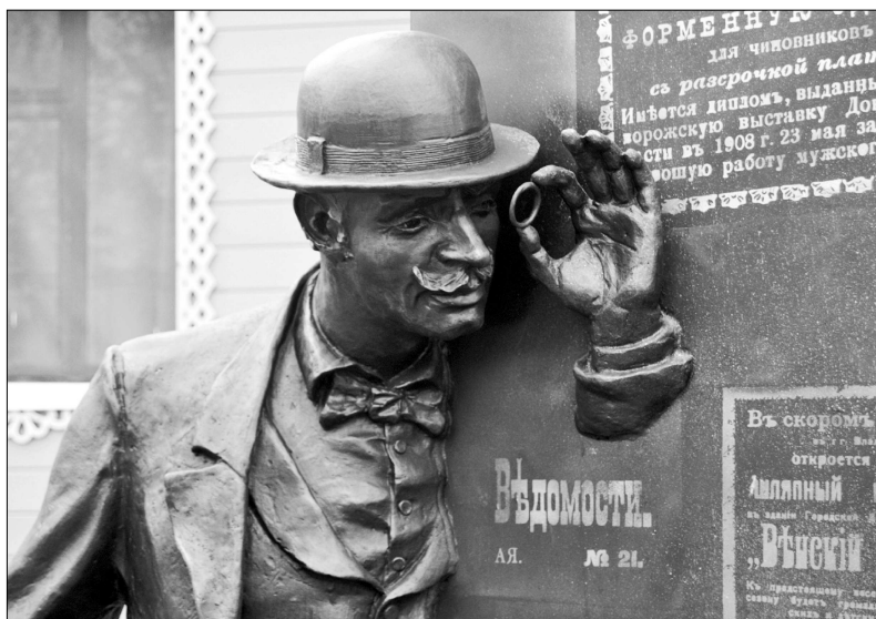
Филер ловит шалопаю

На информационной табличке рядом со скульптурной композицией указано, что мужчина — «доблестный сотрудник сыскальной полиции» — ведет «наружку» за владимирскими шалопаями, которые «промышляли» в центральной торговой части дореволюционного Владимира, хотя основной их задачей была слежка за неблагонадежными.