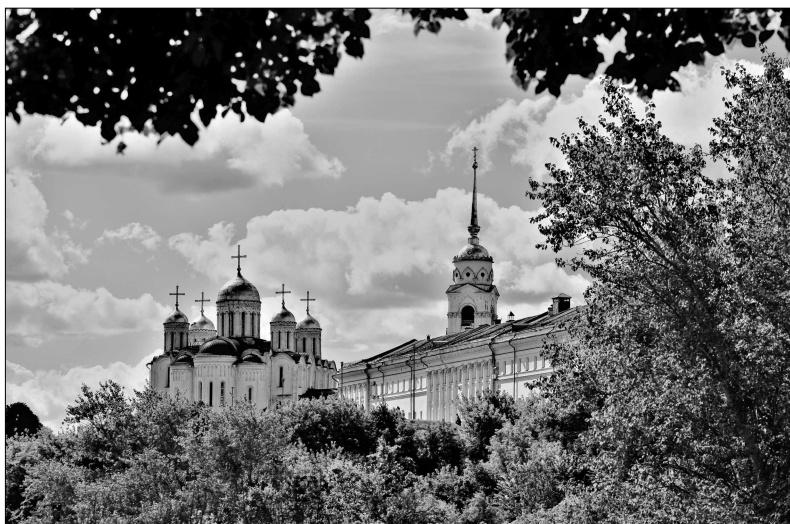
Вид на Успенский собор со стен Рождественского монастыря

Владимиро-Суздальского княжества. Интересно, что у него два заказчика и два времени постройки.