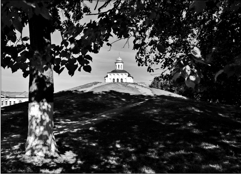
Золотые ворота — неожиданный вид