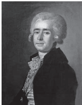
М. И. Бельский. Портрет Дмитрия Степановича Бортнянского. 1788 г.