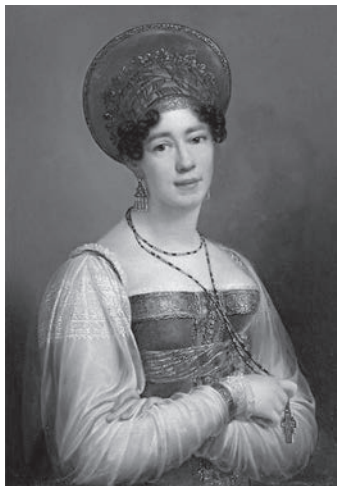
Ф. Кинсон. Портрет Софьи Петровны Свечиной. 1816 г.