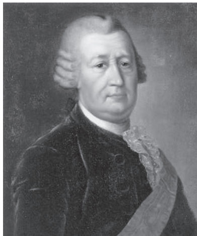
Неизвестный художник. Федор Иванович Соймонов. 1750-е гг.