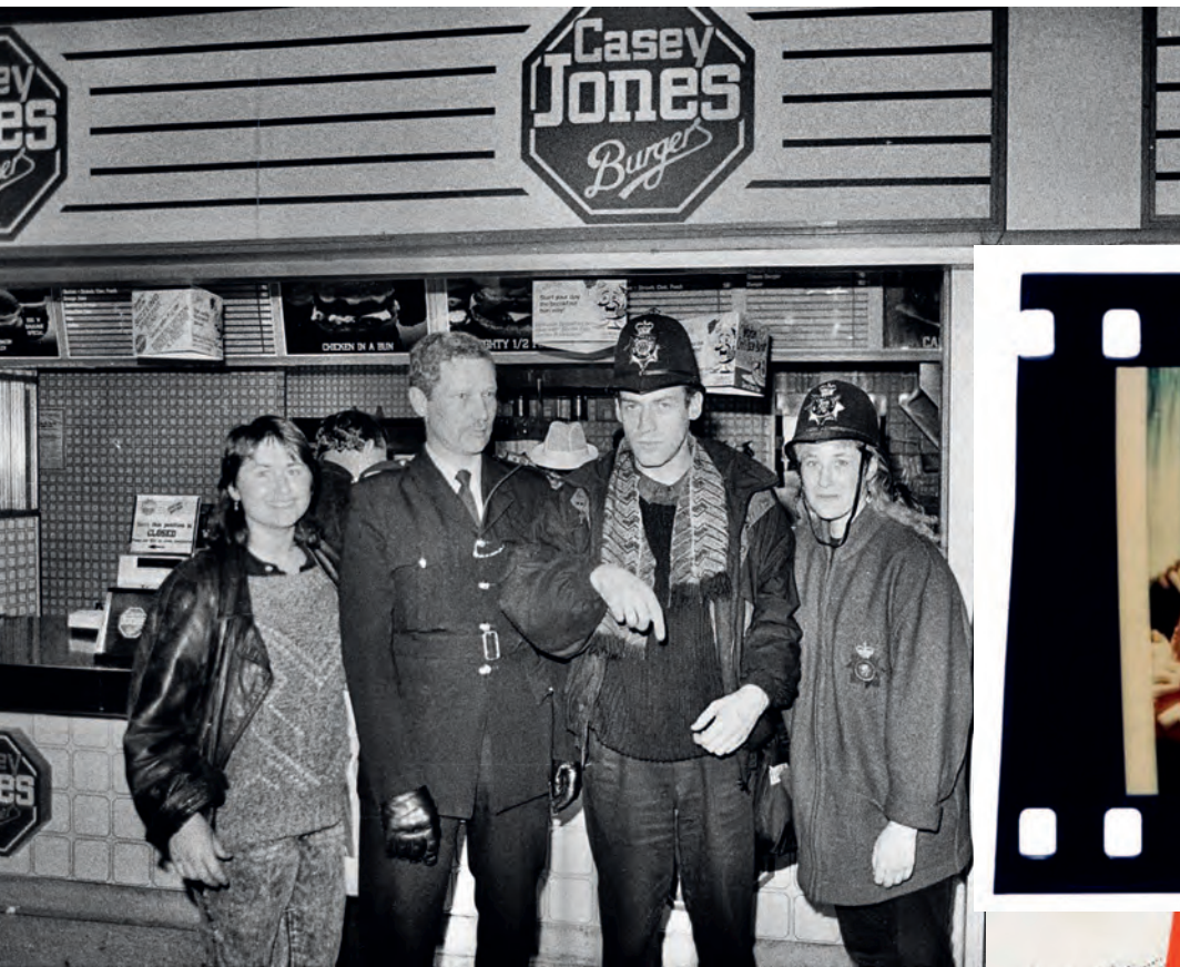
Пол Маккартни и Артём Троицкий в Лондоне в 1988 году.