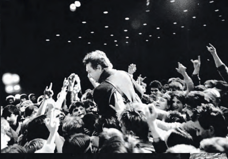
◀ Костя Кинчев в море поклонников. Ленинградский Дворец молодежи. 1987.