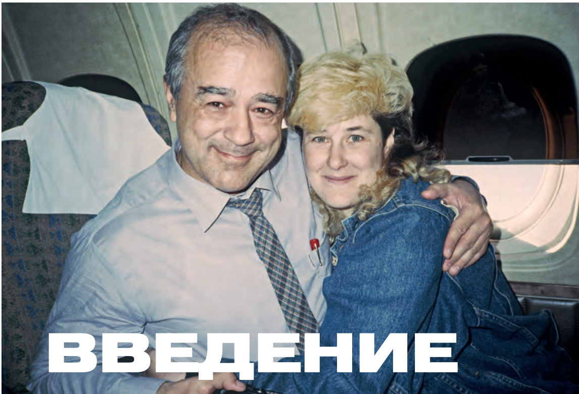
Джоанна с Виталием Коротичем из журнала «Огонёк». Конец 1987.

Конец 80-х был в России прекрасным временем. Гласность была в полном разгаре, люди на улицах казались заметно свободнее и счастливее. Новая эра наступила и в русском роке – период андерграунда остался в истории. Русский рок звучал по радио и ТВ, а группы могли свободно играть и гастролировать по всему Советскому Союзу. На сцену Рок-клуба вышло множество новых интересных групп, появление которых в 1987 году я пропустила из-за своего статуса «врага государства» и невозможности приезжать в Россию. Было поэтому особенно приятно видеть, что жизнь в Рок-клубе и на рок-сцене в стране бьет ключом с появлением таких групп, как «ДДТ», «Наутилус Помпилиус», «Телевизор», «Чайф», «Калинов Мост» и многих других. Чуть ли не самым главным в 1988, 1989 и 1990 годах стала появившаяся наконец у моих друзей возможность выезжать на Запад и в том числе побывать и у меня дома. Еще не так давно это казалось невыносимым, но самым чудесным образом один за другим в Штаты приезжали и побывали у меня в гостях в Лос-Анджелесе Артём Троицкий, Борис Гребенщиков, Юрий Каспарян, Виктор Цой, Сергей Курёхин, Алекс Кан, Африка и другие. Я была вне себя от радости и возбуждения и не жалела сил и времени показать им мою другую, американскую жизнь и дать им увидеть воочию и испытать то, о чем они еще недавно могли только мечтать. Я теперь была замужем за человеком, который был любовью моей жизни, все казалось возможным.