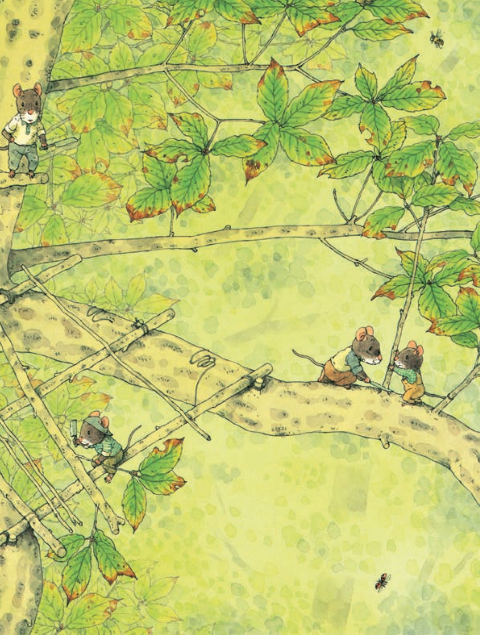
Божья коровка и гусеница-землемер приползли посмотреть.