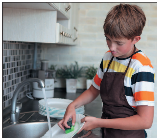
Выполнение полезных домашних дел приблизит к получению карманных денег.

Почему важно заключить подобное соглашение? Когда вы договоритесь, за что тебе платят, родители будут ожидать, что ты станешь это делать регулярно. И могут даже прописать штрафы за невыполнение обязанностей.