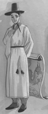
ПРИЗРАК СИН ЧАНЕЛЬ