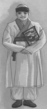
ПРИЗРАК АН ХЮНСУ