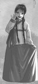
МОККВИСИН ДУХ СОСНЫ