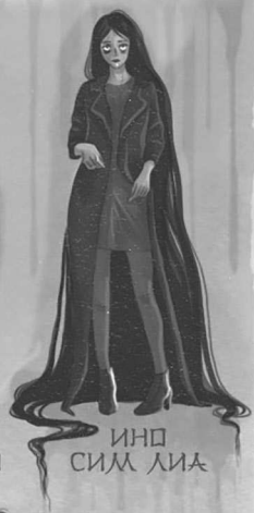
ИНП СИМ ЛИА