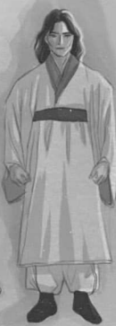
ПРИЗРАК ДЖИ ПЭУН