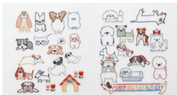
с. 30 Virtuозные актёры с. 31