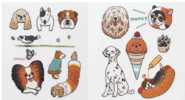
с. 24 Вы только посмотрите на него! с. 25