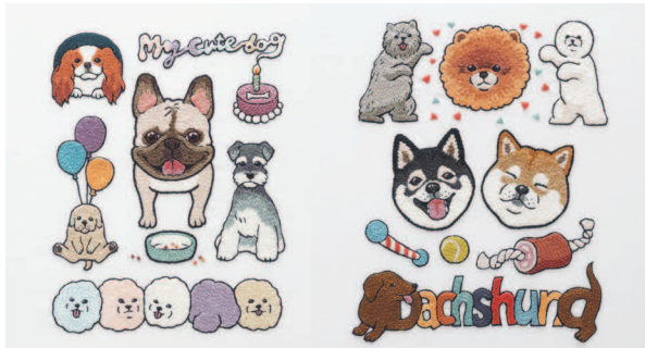
с. 20 Изумительные улыбки с. 21