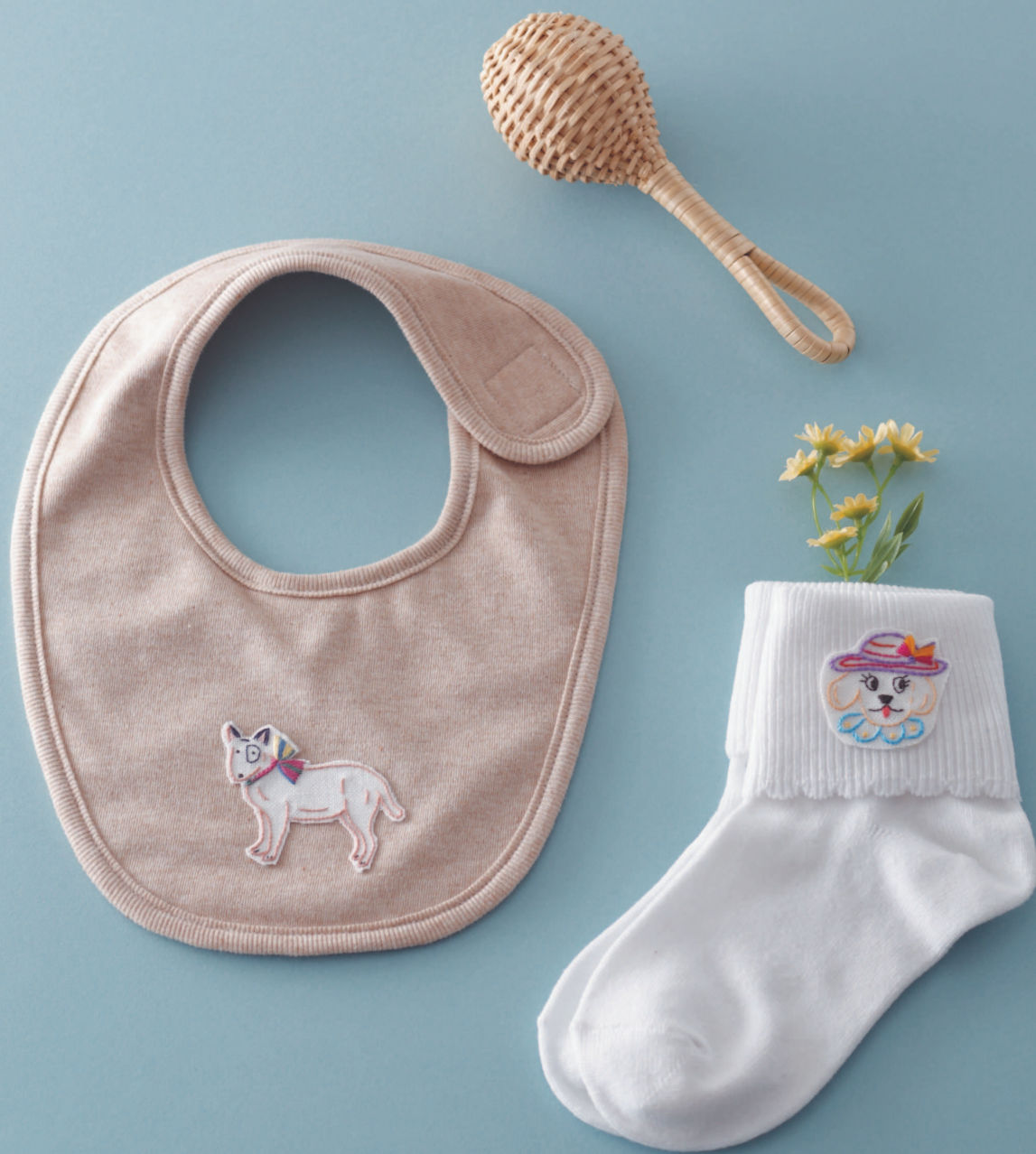
Фото на с. 35, 37 (160, 185)

Вышивкой можно также украсить слюнявчик или детские носочки.