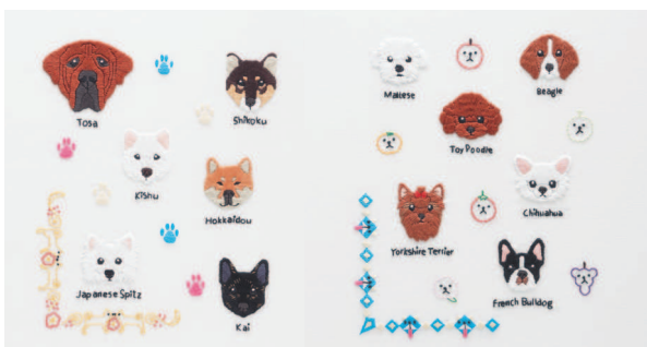
с. 28 От мала до велика с. 29