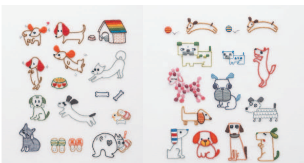
с. 32 Просто обожают дурачиться! с. 33