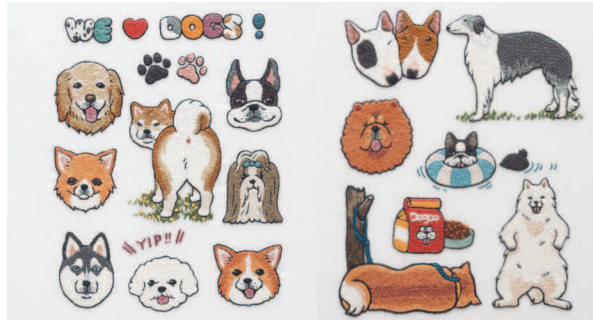
с. 22 Как таких не любить! с. 23