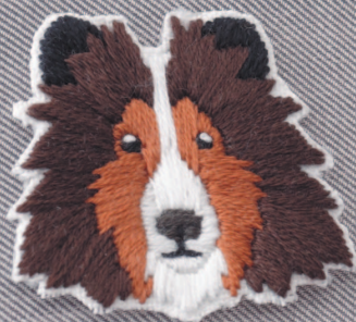
Фото на с. 27 (58)

Изюминка для однотонного полотна зонта. Если вы используете водоотталкивающий спрей — нет проблем: вышивке будет нестрашен и он!