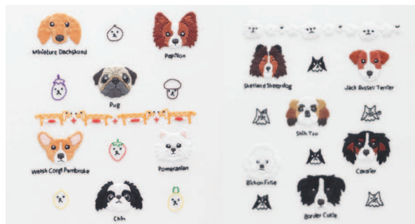
с. 26 Любимчики с. 27