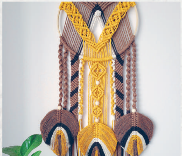
ПАННО «ЛОВЕЦ СНОВ»