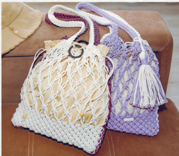
СУМОЧКА АВОСЬКА 96