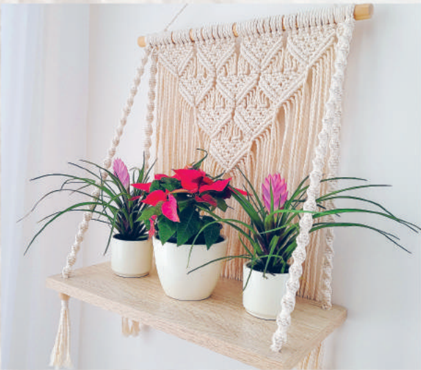
ПАННО С ПОЛОЧКОЙ ДЛЯ ЦВЕТОВ