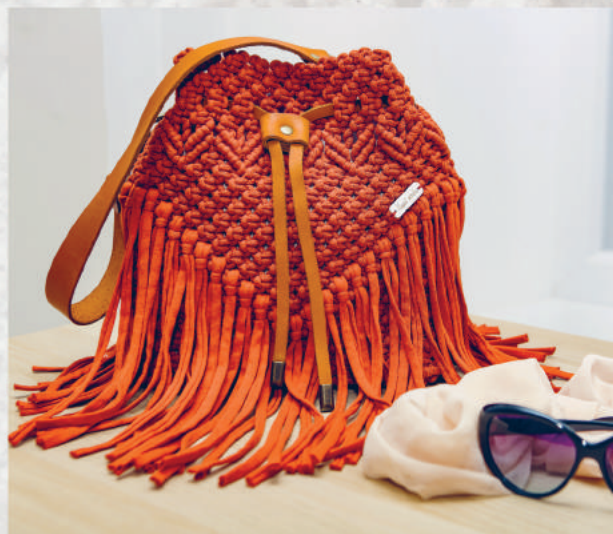
СУМКА БОХО «АРФИН» 146