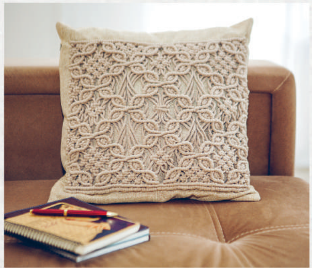
ДЕКОР ПОДУШКИ С УЗОРОМ МАКРАМЕ