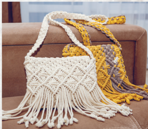
СУМКА БОХО 114