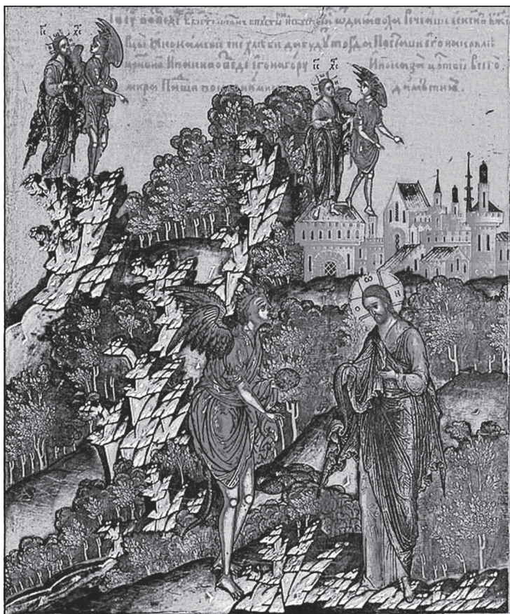
Искушение Христа. Клеймо иконы Спас Вседержитель. 1682. Симеон Холмогорец

хлебом». На что Иисус отвечал: «Написано, что не хлебом одним будет жить человек, но всяким словом, исходящим из уст Божиих». Дьявол возвел Его на высокую гору и показал вся царствия вселенной во мгновение времени: «Тебе дам власть над всеми сими царствами и славу их, ибо она передана мне, и я, кому