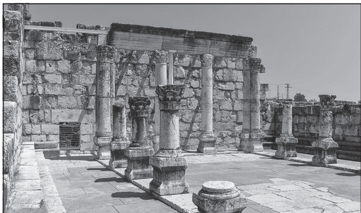
Руины Белой синагоги, где проповедовал Иисус Христос в Капернауме

ственников или посторонних вредно, оно может привлечь нас к миру и погасить огонь нашего умиления.